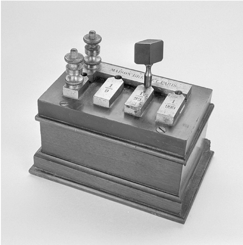
Shunt : vue d'ensemble.

25, Besançon, 34, 36, 41 à 43 avenue de l' Observatoire, lieudit : la Bouloie