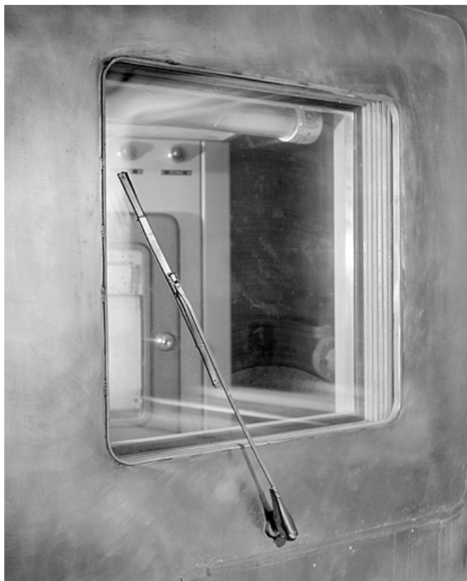
Enceinte d'essais : essuie-glace sur la face intérieure de la vitre.

25, Besançon, 34, 36, 41 à 43 avenue de l' Observatoire, lieudit : la Bouloie