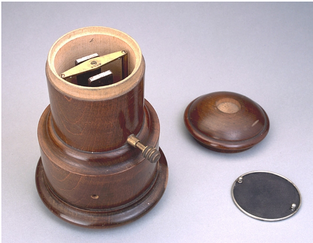
La machine, couvercle enlevé.

25, Besançon, 34, 36, 41 à 43 avenue de l' Observatoire, lieudit : la Bouloie