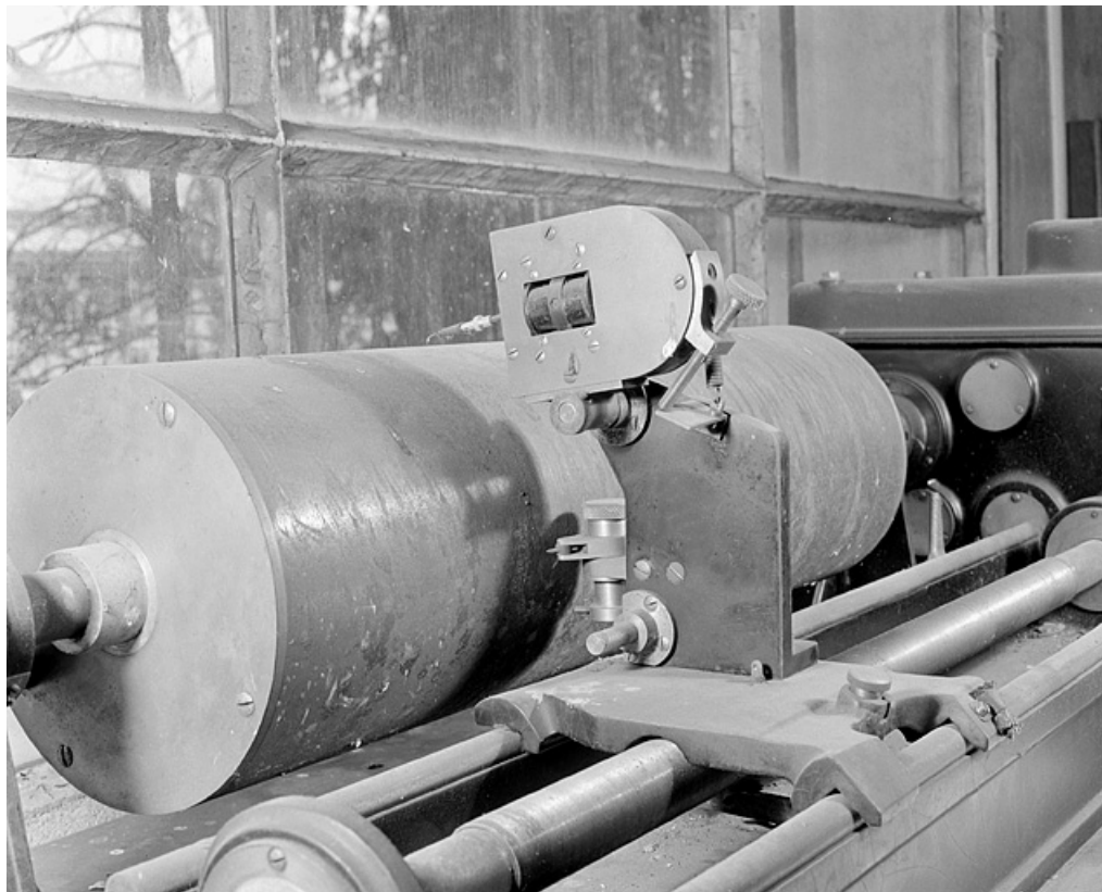
Cylindre et tête d'écriture.

25, Besançon, 34, 36, 41 à 43 avenue de l' Observatoire, lieudit : la Bouloie