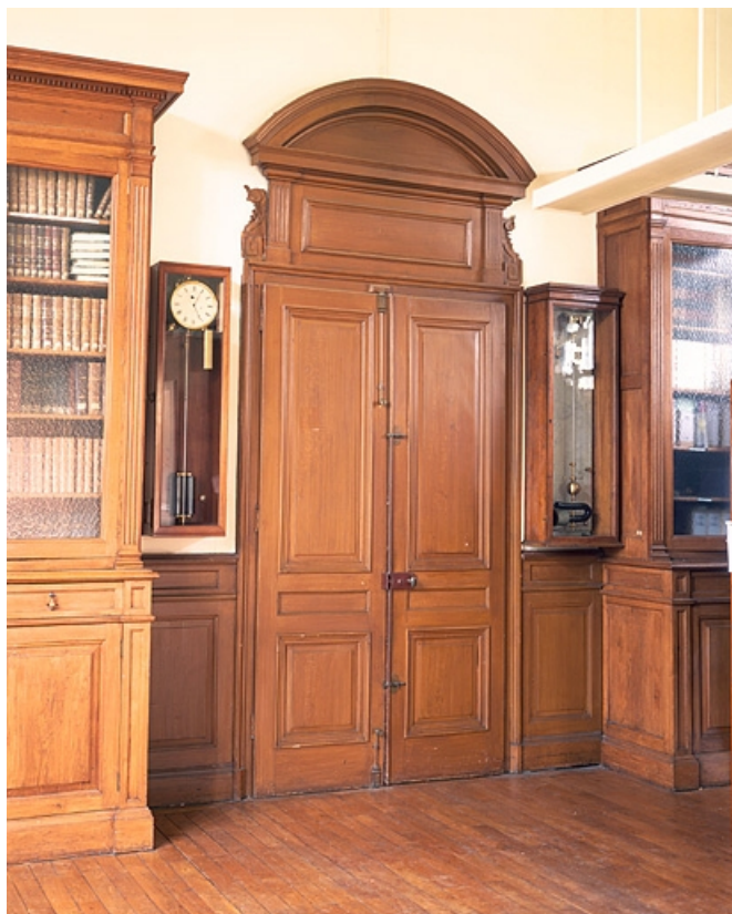
Vue d'ensemble dans la bibliothèque. L'horloge est à droite de la porte.

25, Besançon, 34, 36, 41 à 43 avenue de l' Observatoire, lieudit : la Bouloie