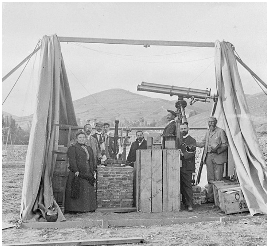
Cistierna. Août 1905. Mission Hamy. Vue générale des appareils prise du SW [membres de la mission de Cistierna et instruments, dont la lunette photographique].

25, Besançon, 34, 36, 41 à 43 avenue de l' Observatoire, lieudit : la Bouloie