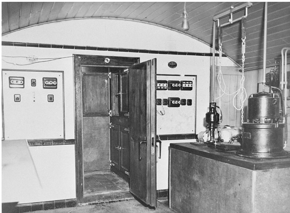
Epreuves thermiques. Frigorifique Barthod Système Eyscher Wiss. Températures de 4°, 0°, -10° et -20°, entre 1932 et 1934. 25, Besançon, 34 avenue de l' Observatoire, lieudit : la Bouloie

Photographie, s.d. [entre 1932 et 1934]. Tirage collé sur un tableau intitulé " Essais de montres et compteurs de l'aéronautique ". Lieu de conservation : Musée du Temps, Besançon Lieu de conservation : Musée du Temps, Besançon