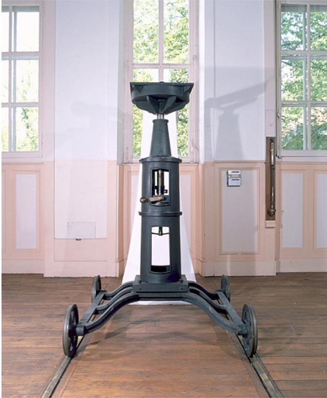
Vue d'ensemble, dans l'axe des rails.

25, Besançon, 34 avenue de l' Observatoire, lieudit : la Bouloie