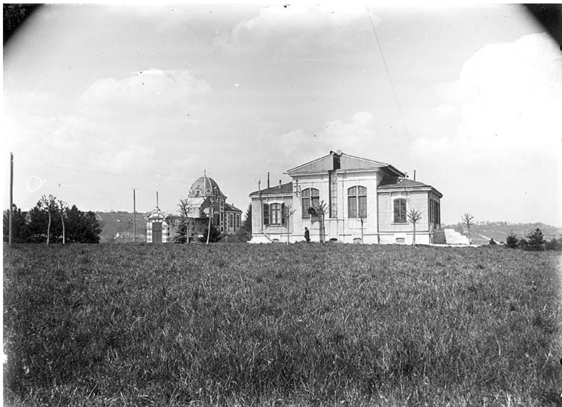
[Vue d'ensemble des pavillons de la méridienne et de l'équatorial coudé], 1er quart 20e siècle.

25, Besançon, 34 avenue de l' Observatoire, lieudit : la Bouloie