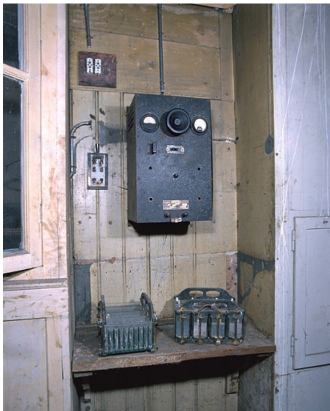
Chargeur de batterie Oxymétal Westinghouse : vue d'ensemble du chargeur et des batteries.

25, Besançon, 34 avenue de l' Observatoire, lieudit : la Bouloie