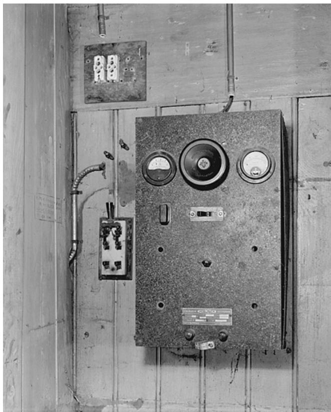
Chargeur de batterie Oxymétal Westinghouse : vue d'ensemble.

25, Besançon, 34 avenue de l' Observatoire, lieudit : la Bouloie