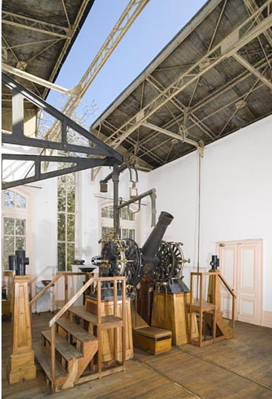
Vue d'ensemble de la salle d'observation et de la lunette méridienne.

25, Besançon, 34 avenue de l' Observatoire, lieudit : la Bouloie