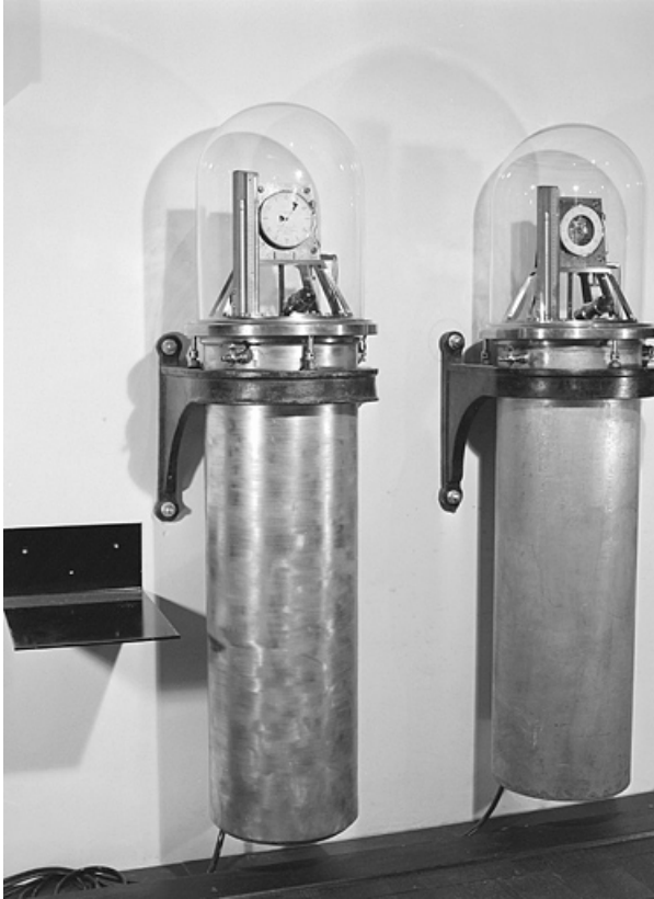
Vue d'ensemble des horloges à pression constante Leroy exposées au Musée du Temps. À gauche horloge n° 1450, à droite horloge n° 1723.

25, Besançon, 34 avenue de l' Observatoire, lieudit : la Bouloie