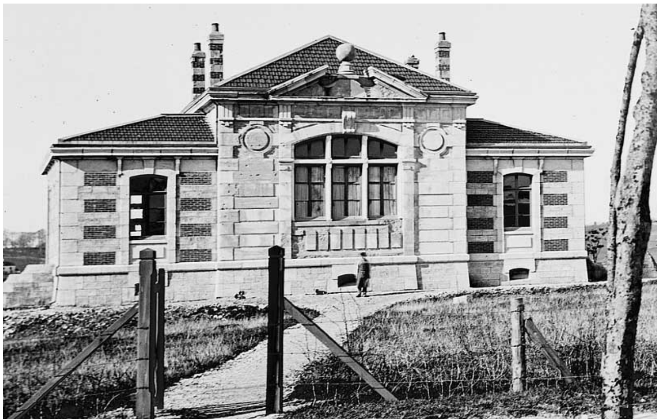
[Vue d'ensemble de la bibliothèque (avec sa façade d'origine)], entre 1884 et 1888.

25, Besançon, 34 avenue de l' Observatoire, lieudit : la Bouloie