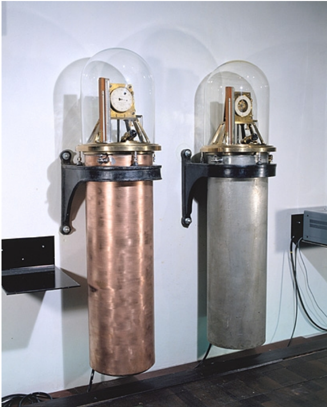
Horloges n° 1450 (à gauche) et 1723 (à droite) exposées au Musée du Temps. 25, Besançon, 34 avenue de l' Observatoire, lieudit : la Bouloie