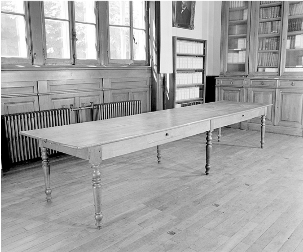
Vue d'ensemble de la table de la bibliothèque.

25, Besançon, 34, 36, 41 à 43 avenue de l' Observatoire, lieudit : la Bouloie