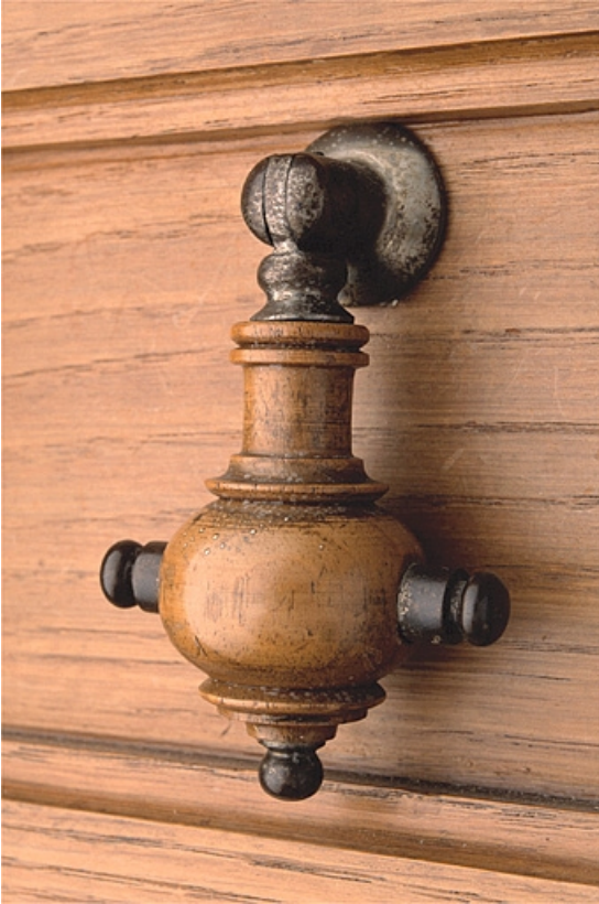
Poignée de tiroir d'une armoire-bibliothèque.

25, Besançon, 34, 36, 41 à 43 avenue de l' Observatoire, lieudit : la Bouloie