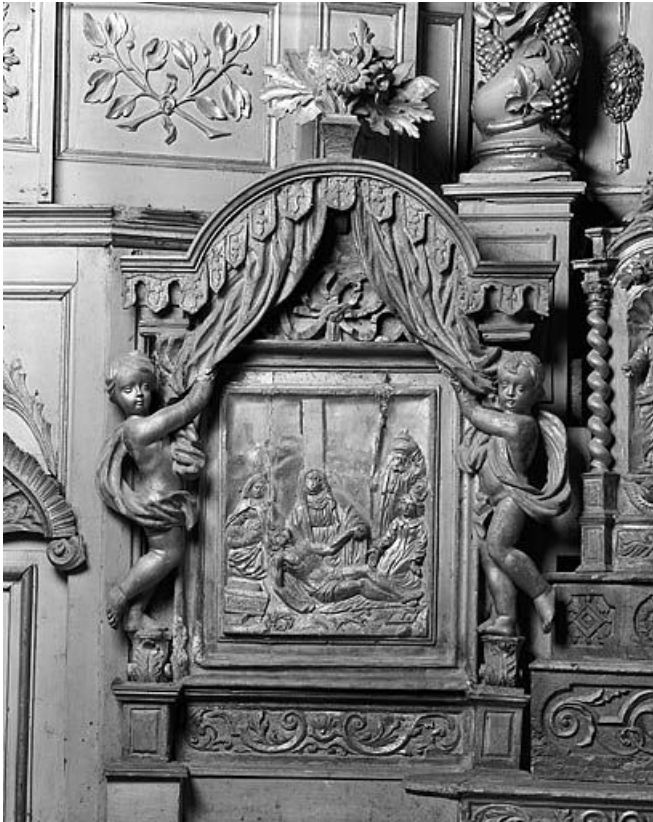
Bas-relief : Déploration sur le Christ mort. 25, Oye-et-Pallet