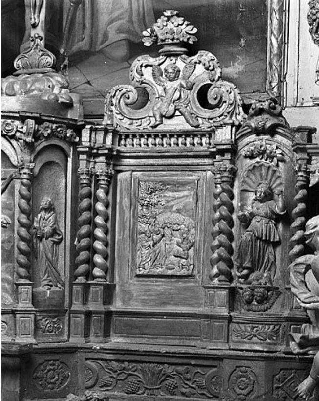
Bas relief : la Manne, aile droite du tabernacle. 25, Oye-et-Pallet