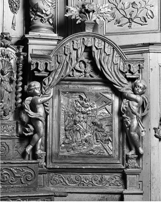
Bas-relief : Adoration des Bergers.