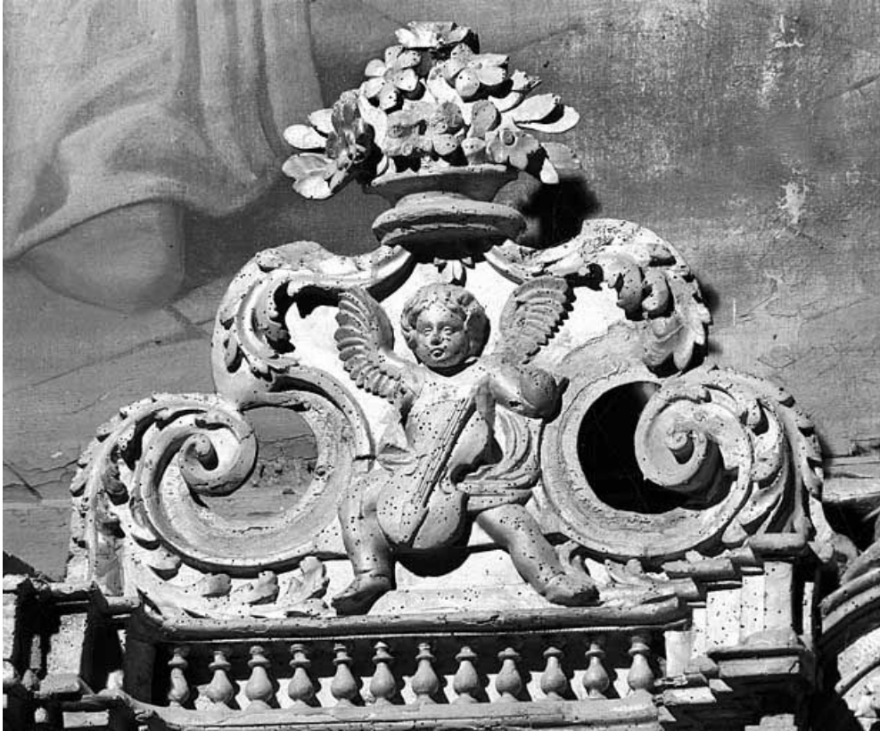
Ange musicien, aile droite du tabernacle. 25, Oye-et-Pallet