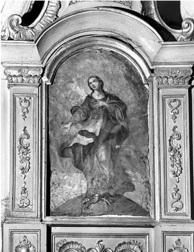
Tableau : Immaculée Conception.