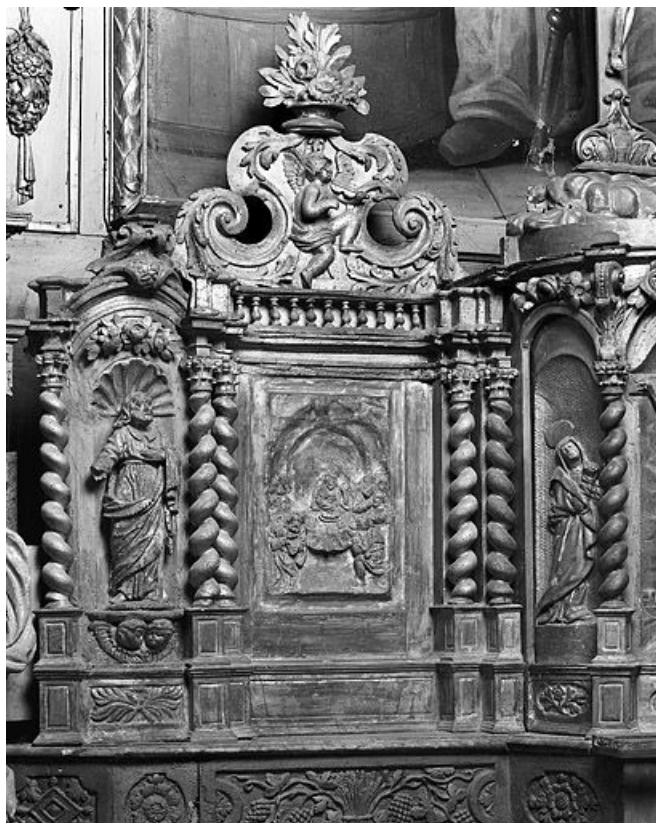
Bas relief : la Cène, aile gauche du tabernacle.