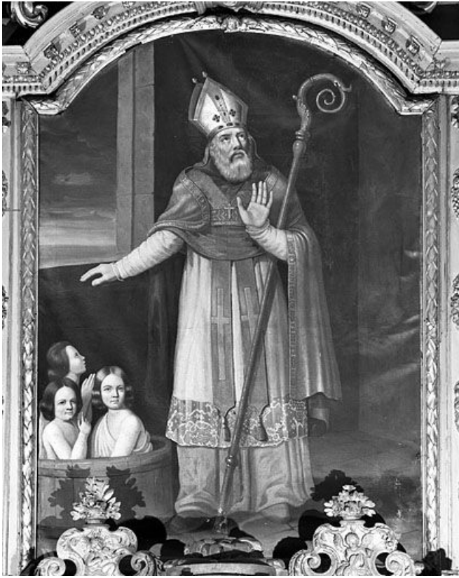
Tableau d'autel : saint Nicolas.