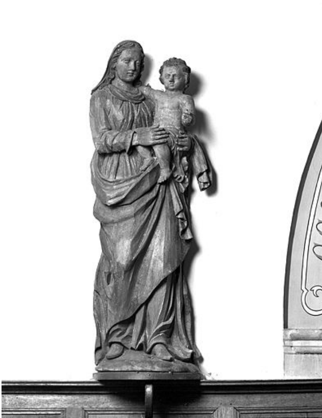
Vierge à l'Enfant.

25, La Cluse-et-Mijoux, lieudit : Montpetot