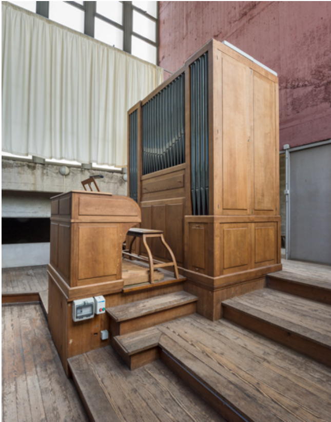
Vue générale de trois quarts droite.