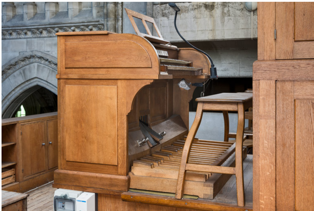
Vue de trois quarts de la console.