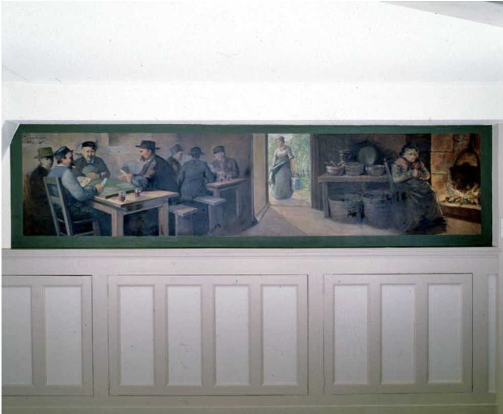
Scène d'auberge, vue générale.