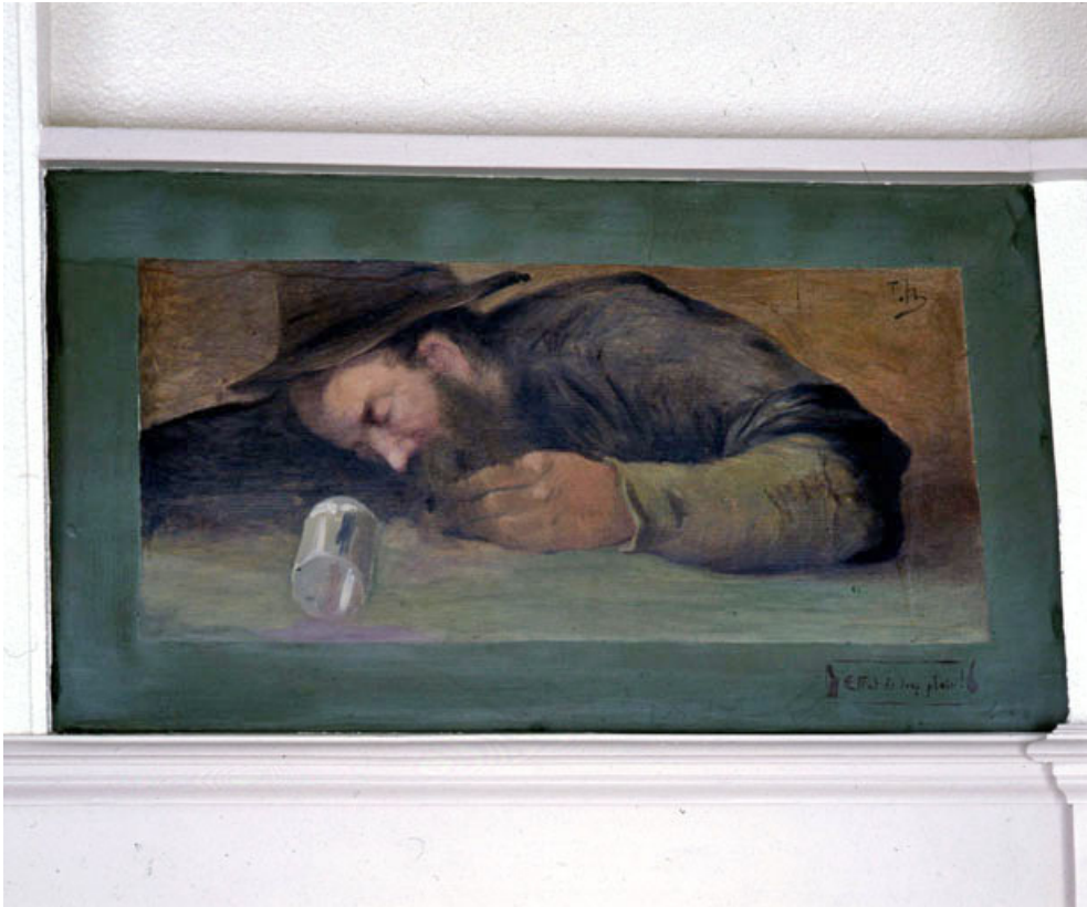
Effet de trop plein I, vue générale.