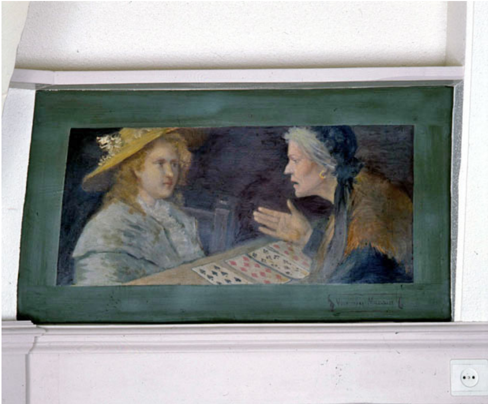
Vous serez marquise !, vue générale.