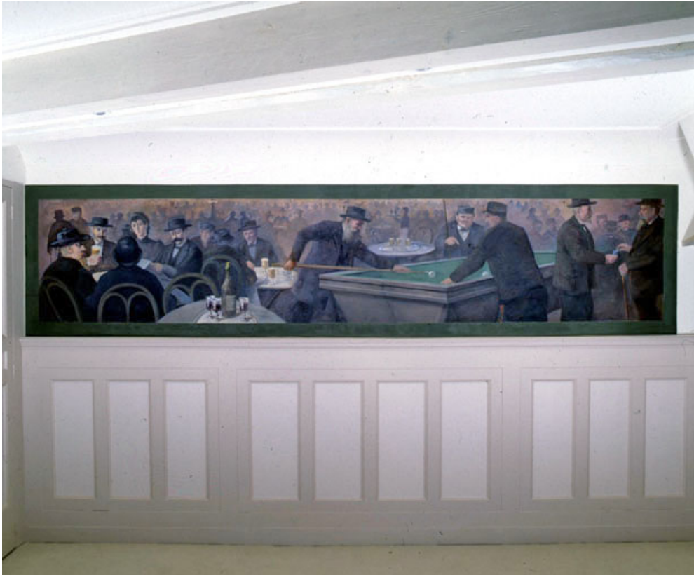
Scène de café, vue générale.