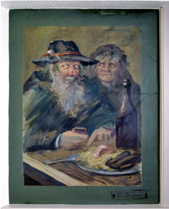
Types dégarnis...et...choucroute garnie !, vue générale.