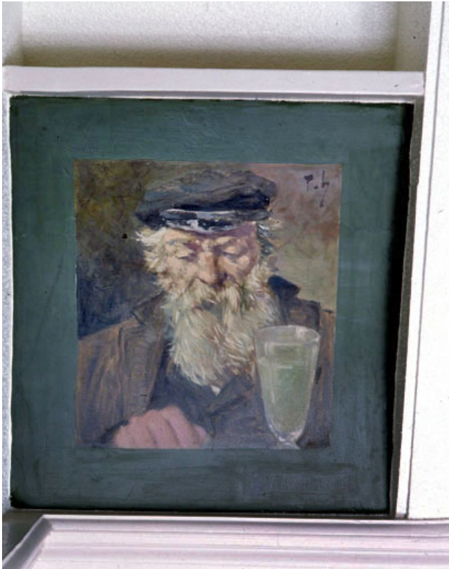
Via delirium tremens, vue générale.