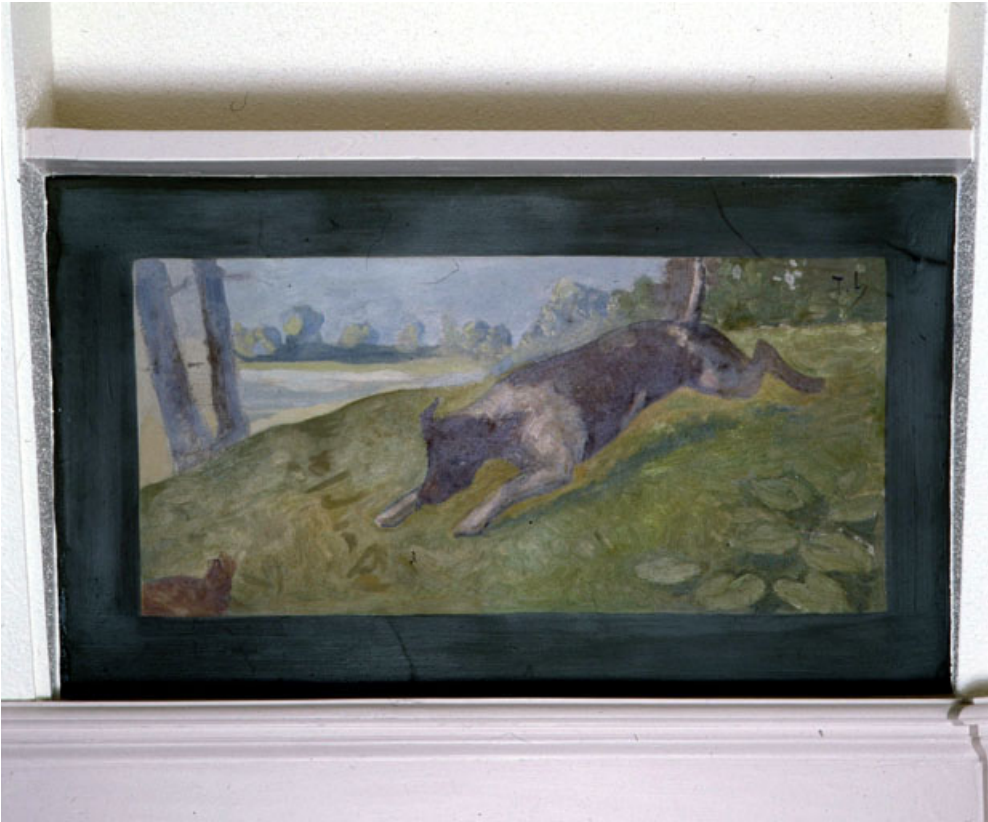
Chien poursuivant un animal, vue générale.