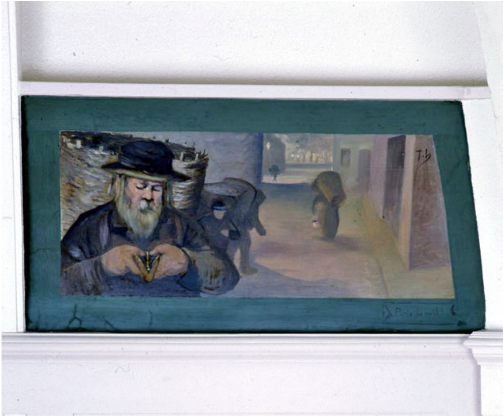
Paris la nuit !, vue générale.