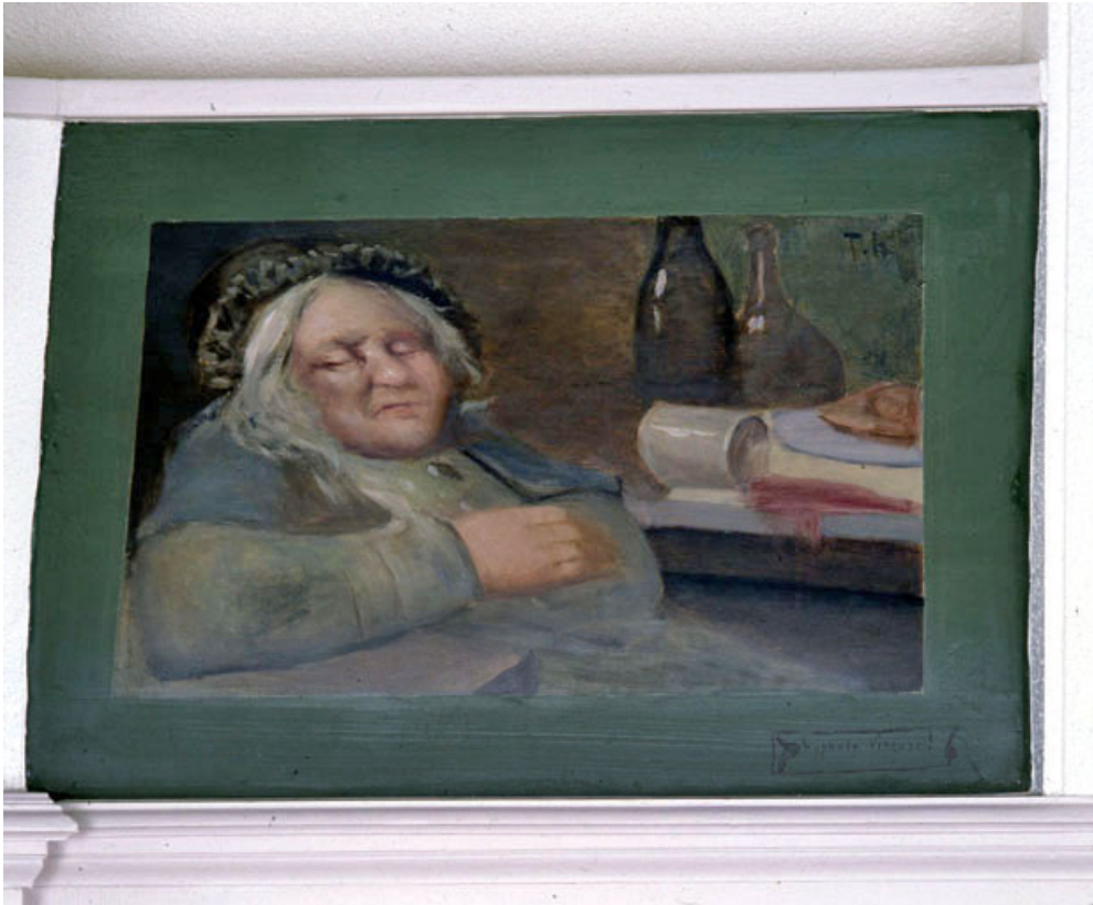
Hypnose vineuse !, vue générale.