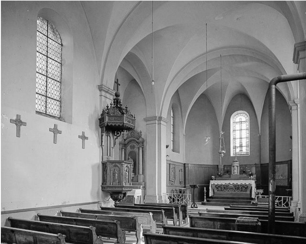
Intérieur : la nef et le chœur vus de trois quarts gauche depuis l'entrée. 25, Bonnevaux-le-Prieuré