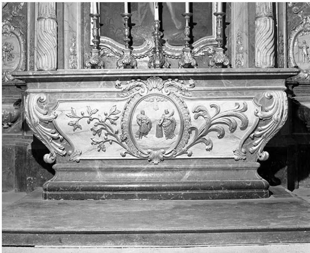
Détail de l'autel secondaire sud : relief de saint Jacques et de sainte Barbe. 25, Montgesoye