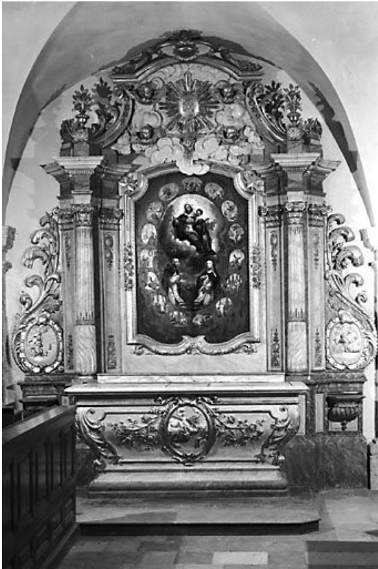
Vue d'ensemble de l'autel secondaire nord. 25, Montgesoye