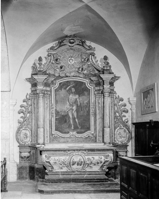
Vue d'ensemble de l'autel secondaire sud. 25, Montgesoye