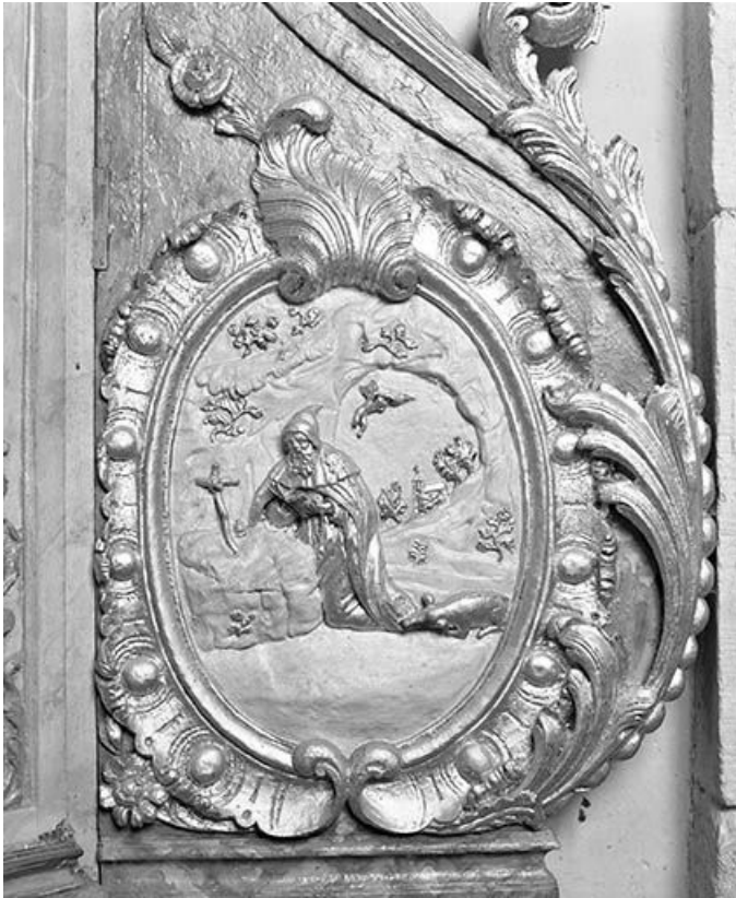
Détail de l'autel secondaire nord : relief de saint Antoine. 25, Montgesoye