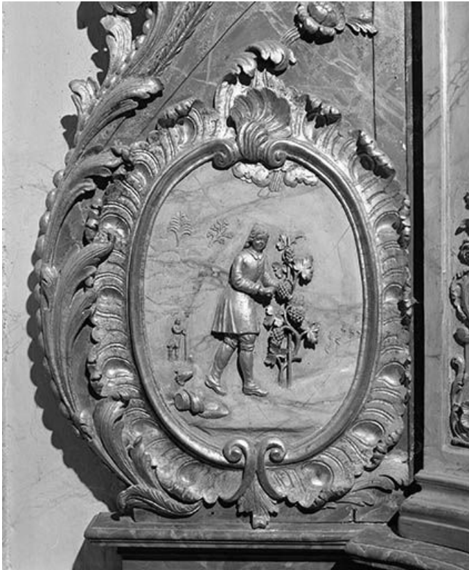
Détail de l'autel secondaire sud : relief de saint Vernier. 25, Montgesoye