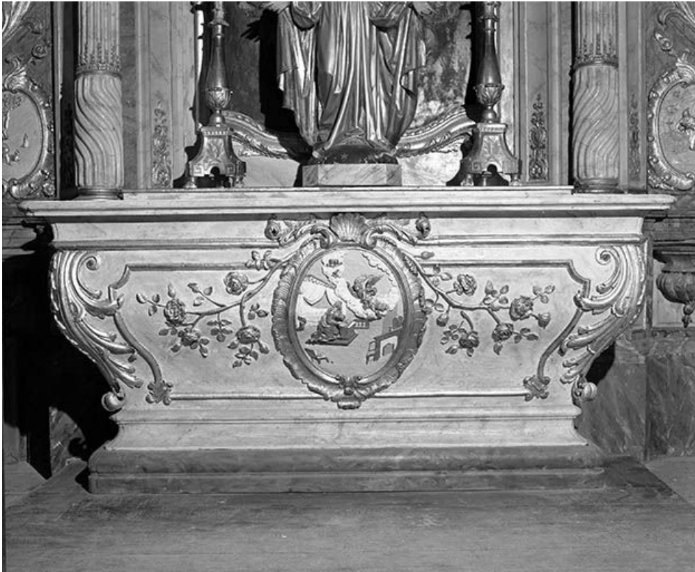
Détail de l'autel secondaire nord : relief de l'Annonciation. 25, Montgesoye