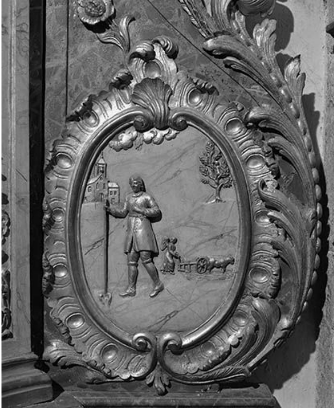
Détail de l'autel secondaire sud : relief de saint Isidore. 25, Montgesoye