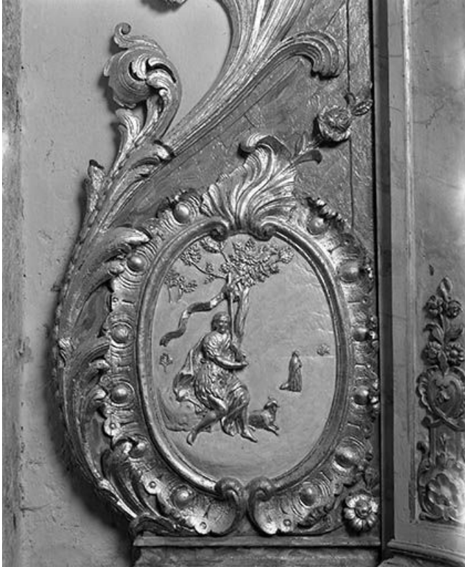
Détail de l'autel secondaire nord : relief de saint Jean-Baptiste. 25, Montgesoye