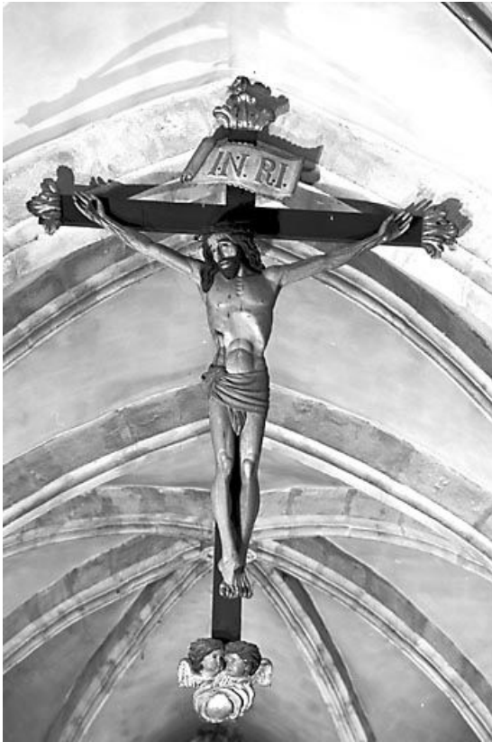
Christ en croix.