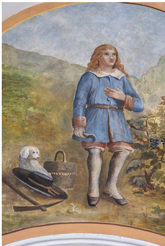
Peinture monumentale : saint Vernier, détail en 2021. 25, Lods