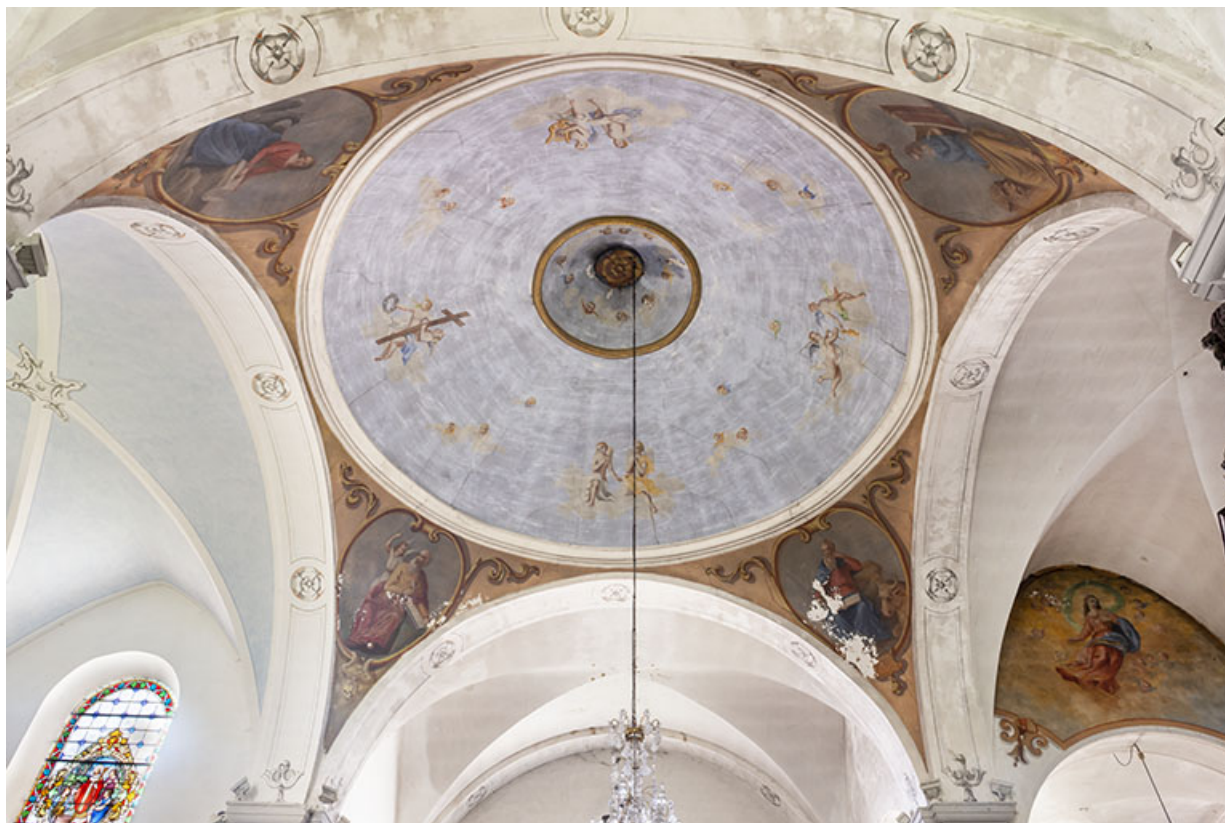
La coupole à la croisée du transept en 2021. 25, Lods