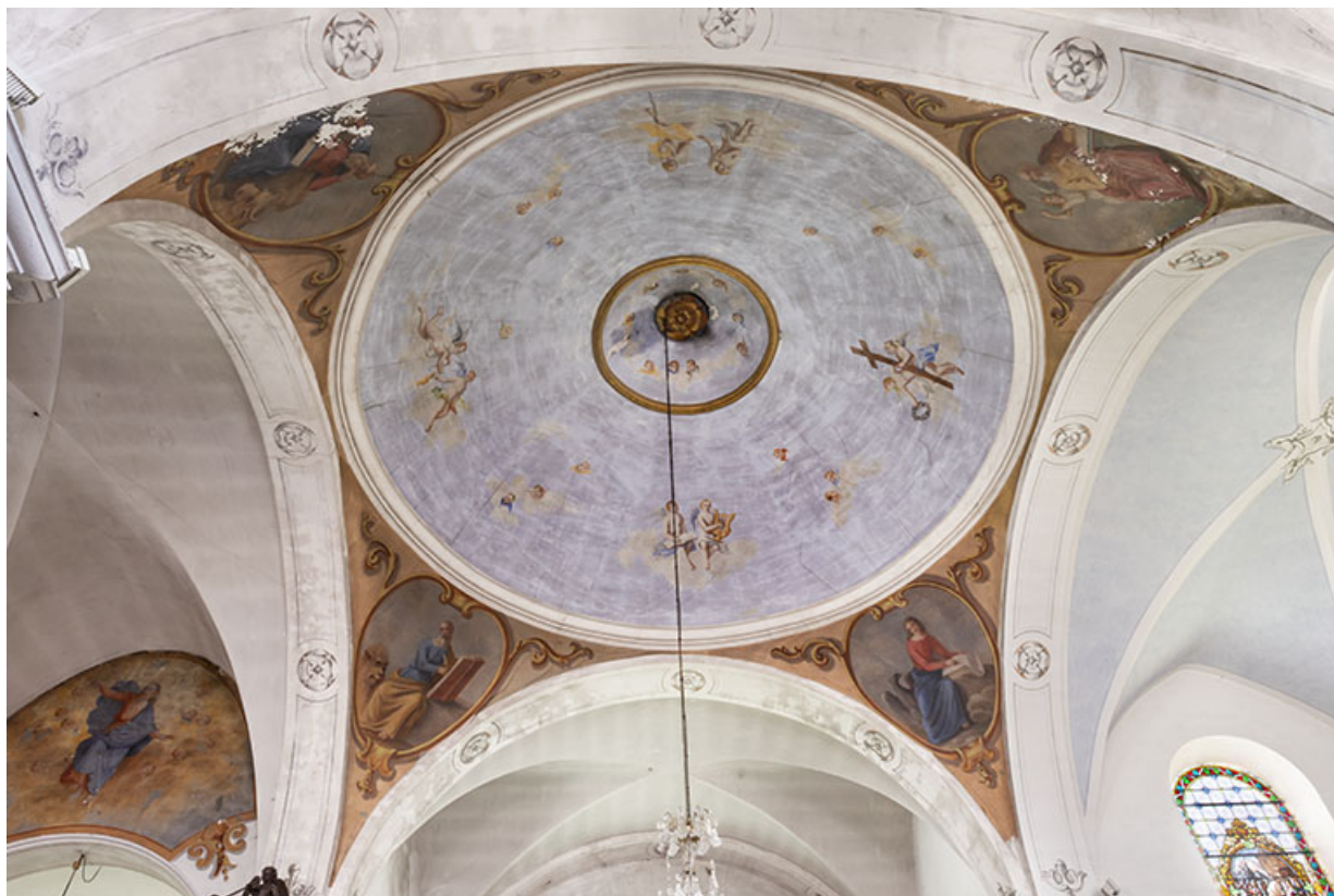
La coupole à la croisée du transept en 2021. 25, Lods