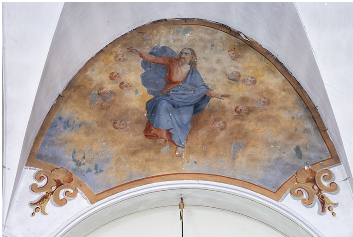
Peinture monumentale : l'Ascension, en 2021 25, Lods