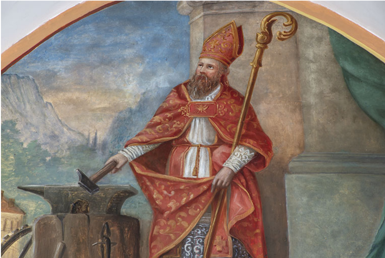
peinture monumentale : saint Eloi, détail, en 2021 25, Lods