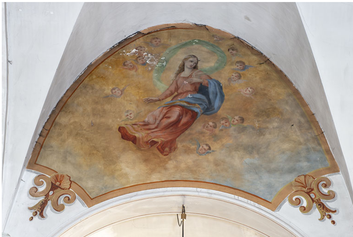
peinture monumentale : l'Assomption, en 2021. 25, Lods