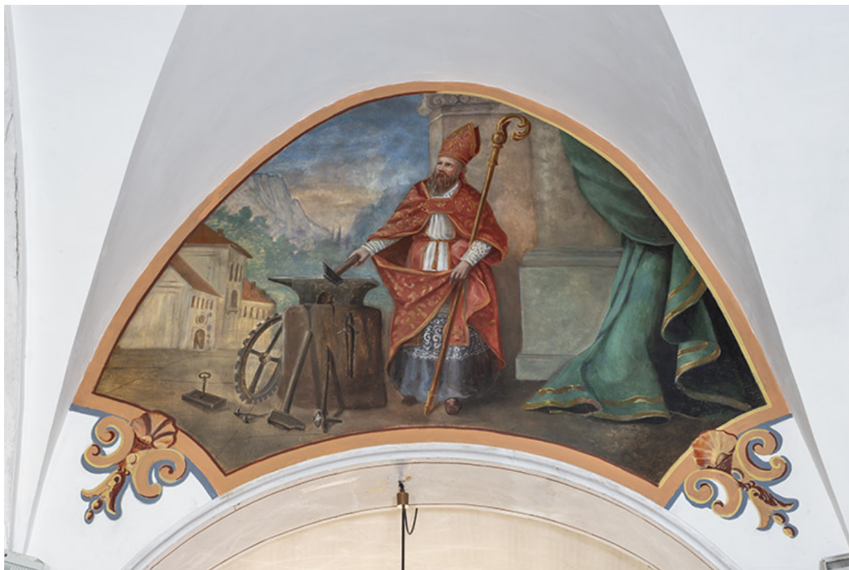
peinture monumentale : saint Eloi, en 2021 25, Lods