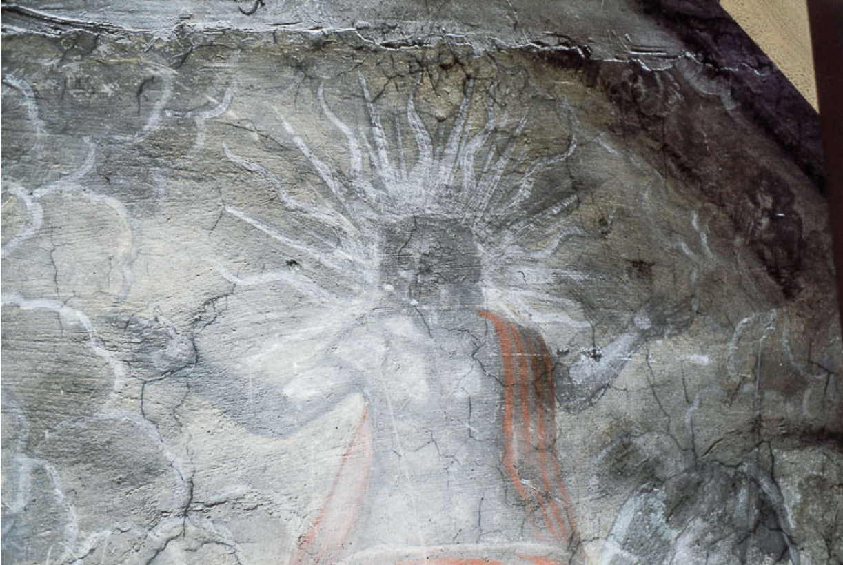
Le Jugement dernier : tête et tronc du Christ.