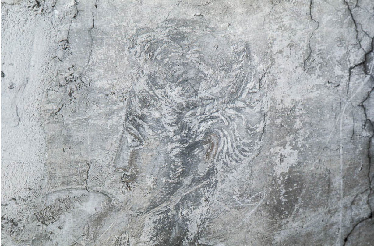
Le Jugement dernier : profil gauche de visage.