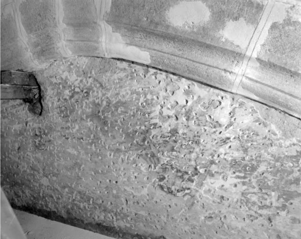
Détail de la scène au niveau de la tribune.