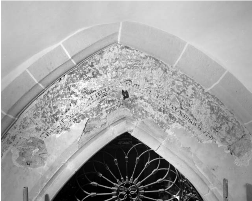
Inscription au-dessus de la porte conduisant à la nef.