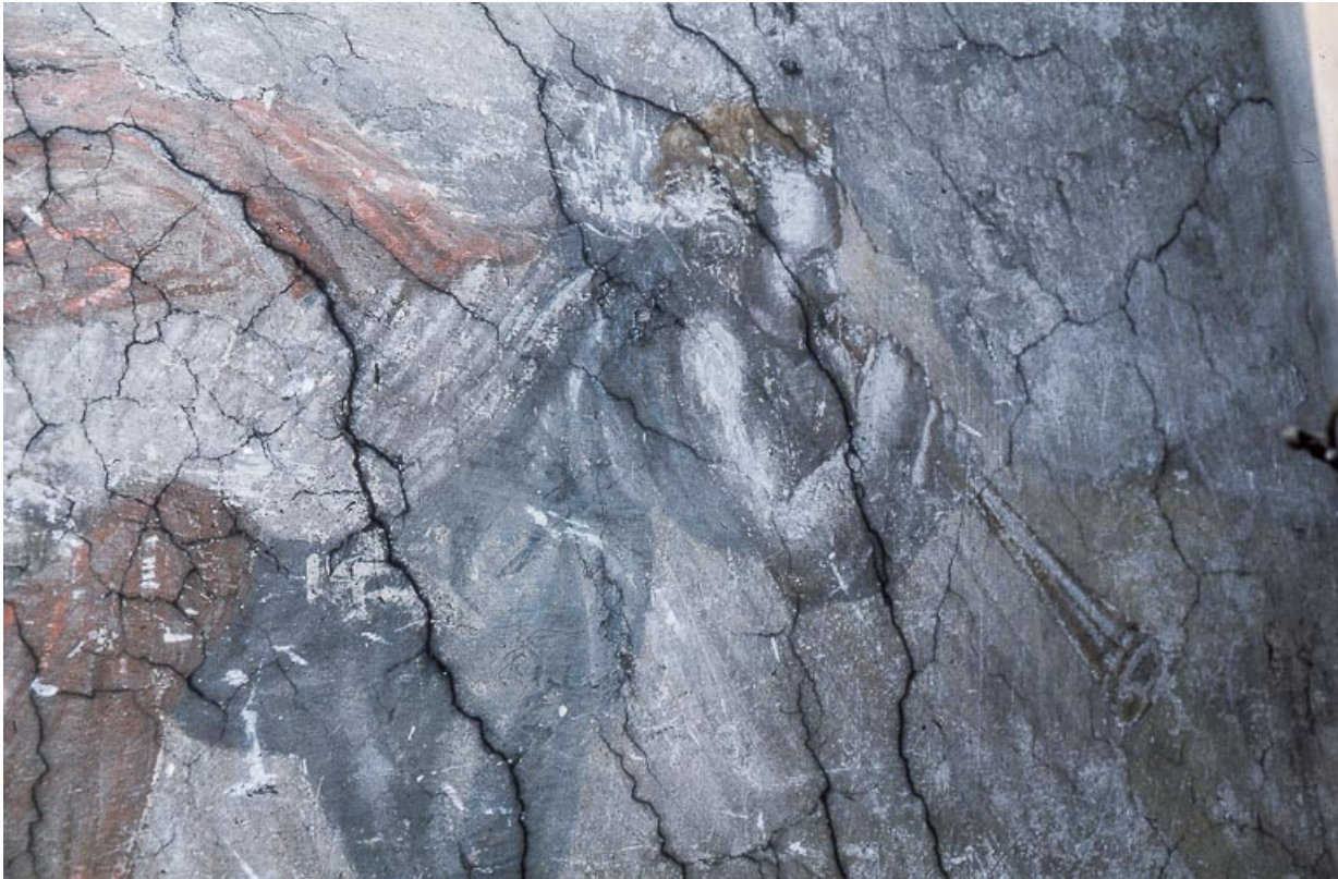
Le Jugement dernier : joueur de trompette.