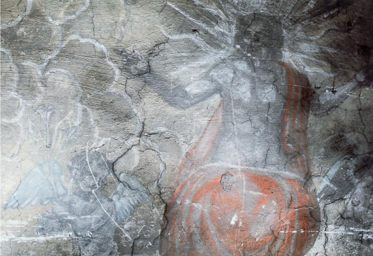
Le Jugement dernier : le Christ et un ange.