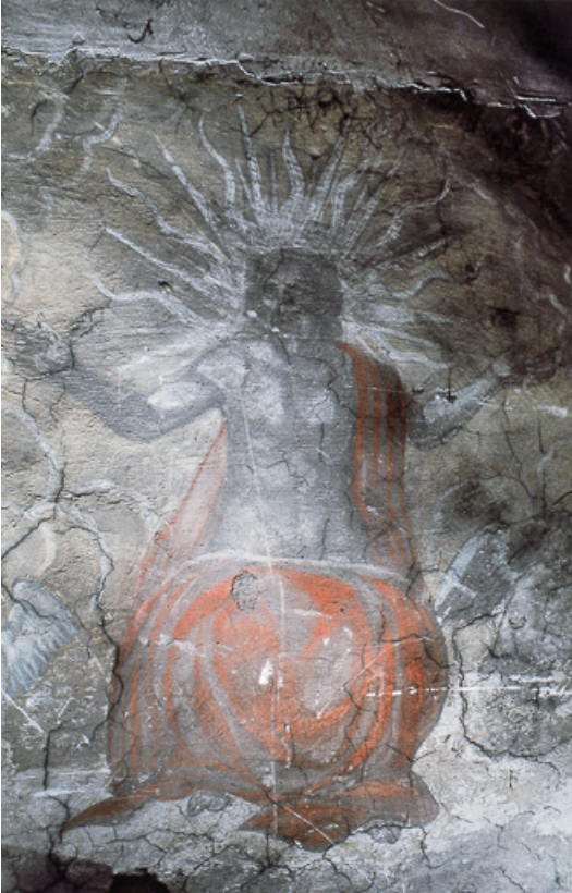
Le Jugement dernier : Christ vu de face.