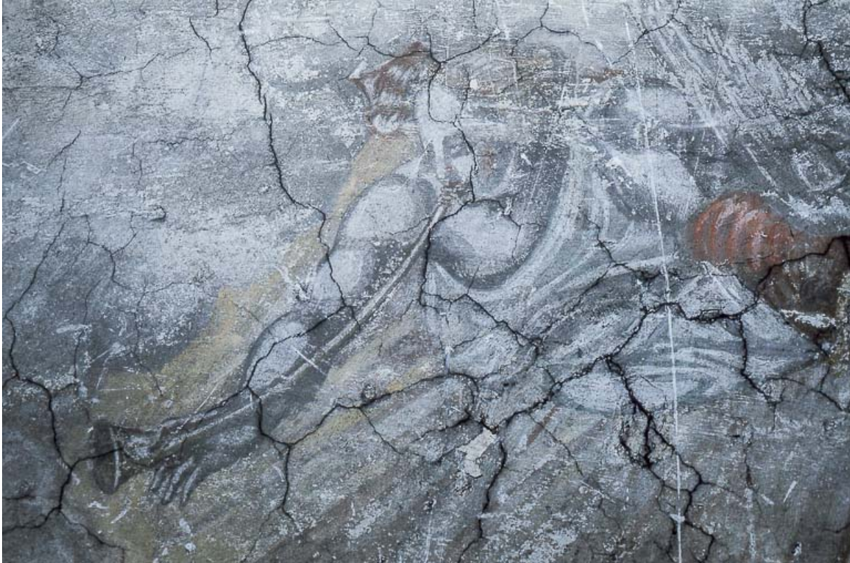
Le Jugement dernier : joueur de trompette.