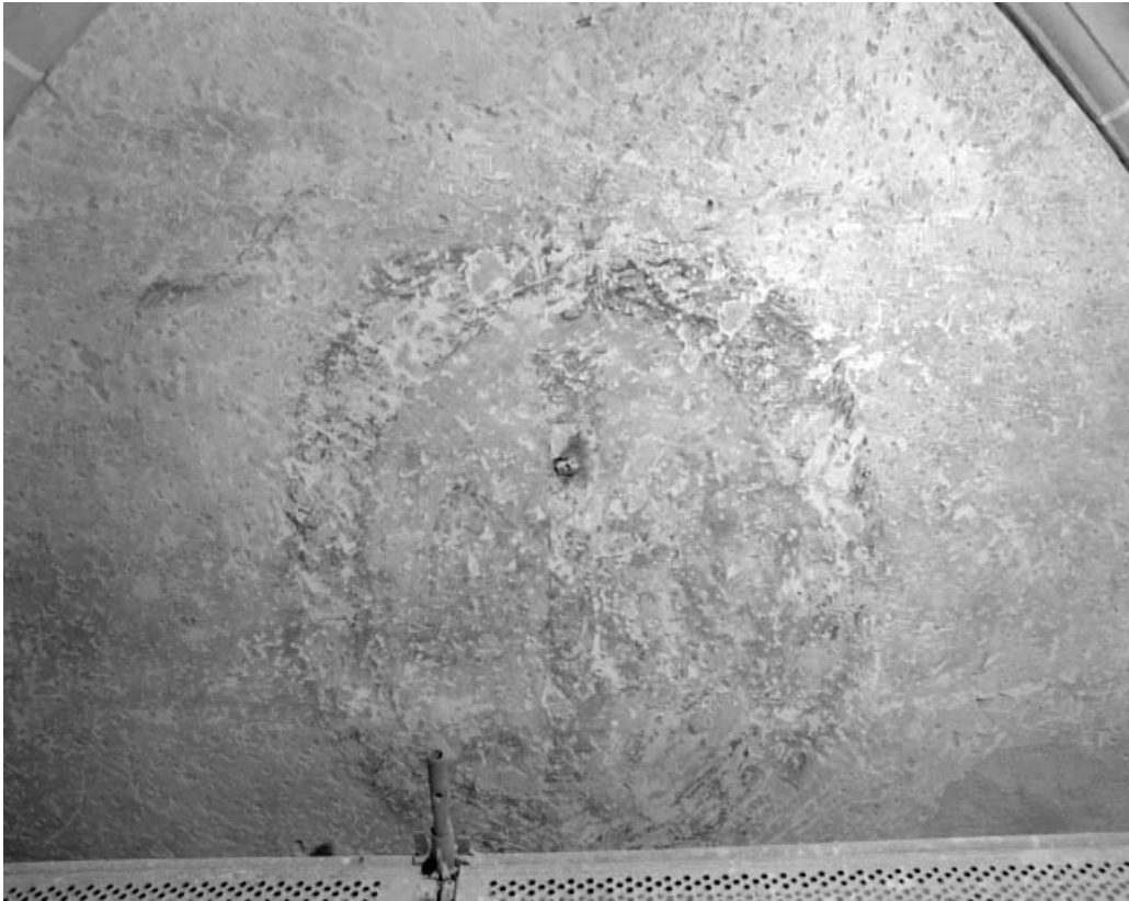
Mur sud de la 1ère travée de la nef.