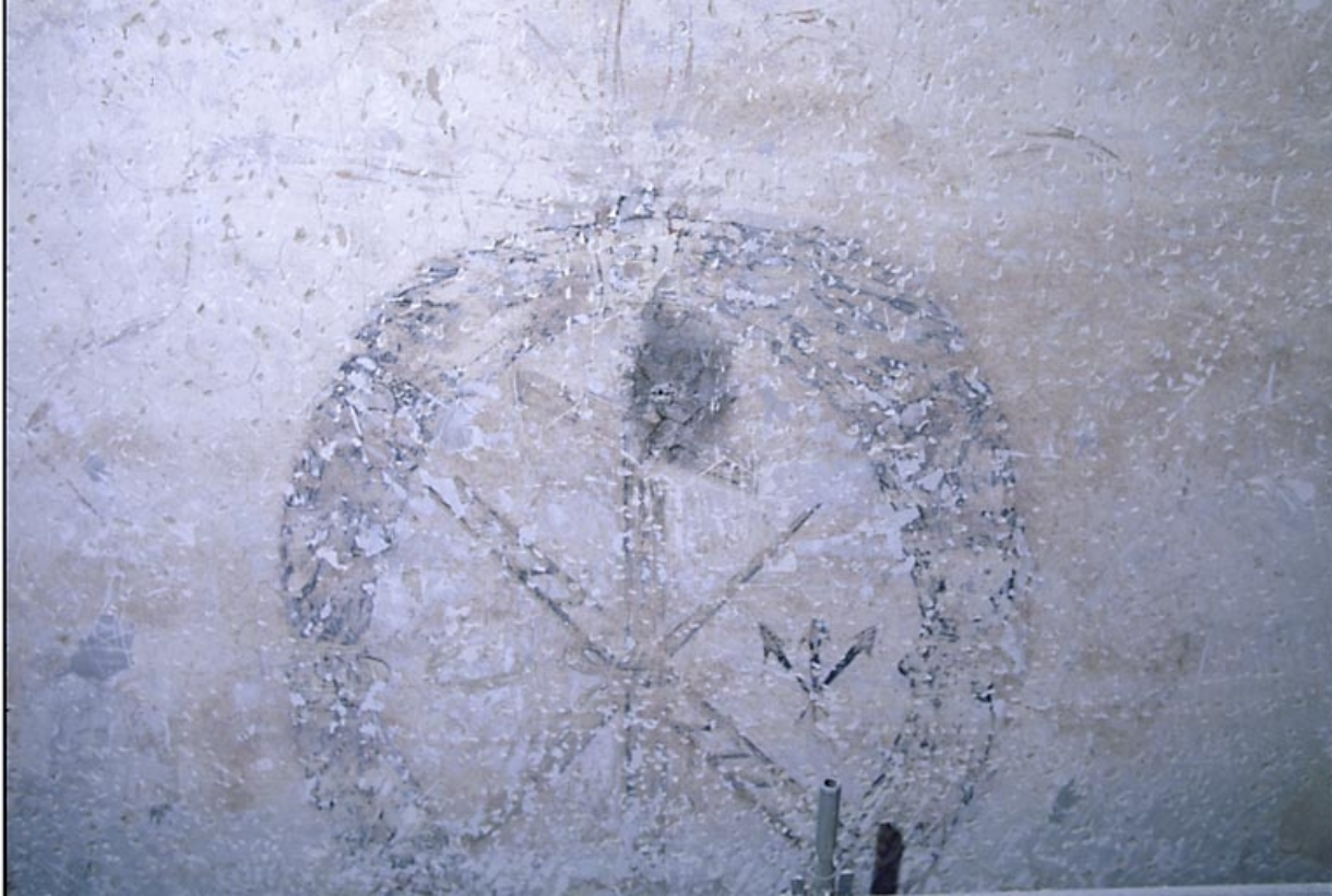
Mur nord de la 1ère travée de la nef.