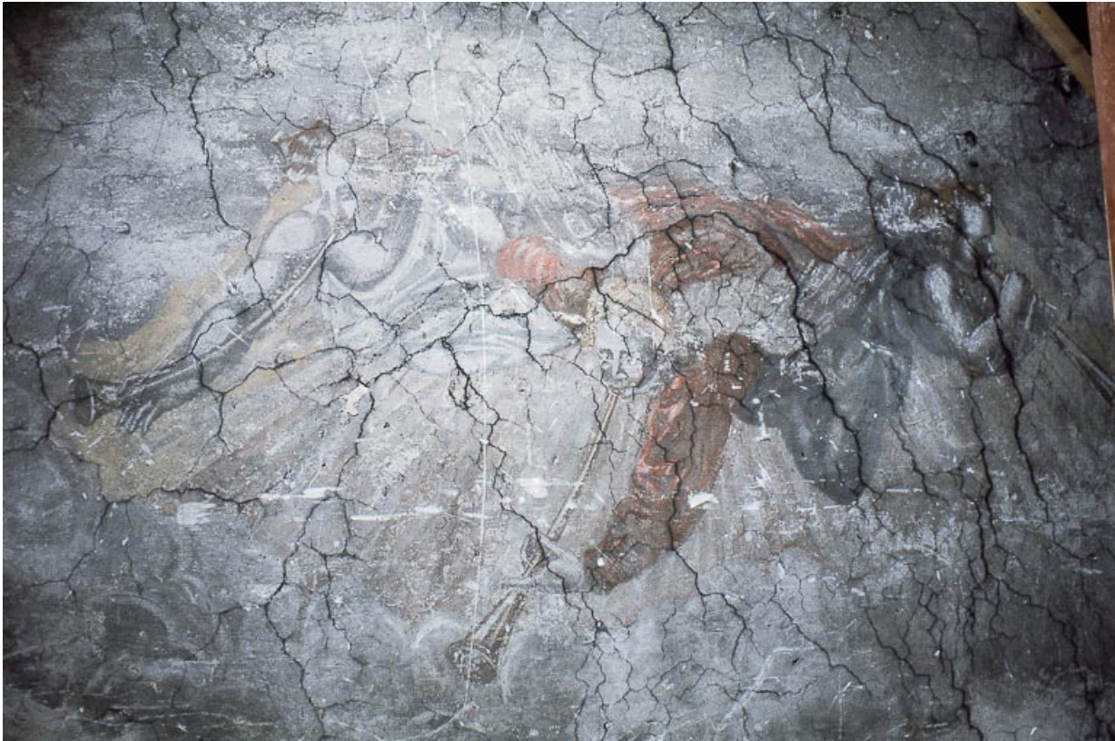
Le Jugement dernier : trois personnages soufflant dans leur trompette. 25, Ornans rue Saint-Laurent