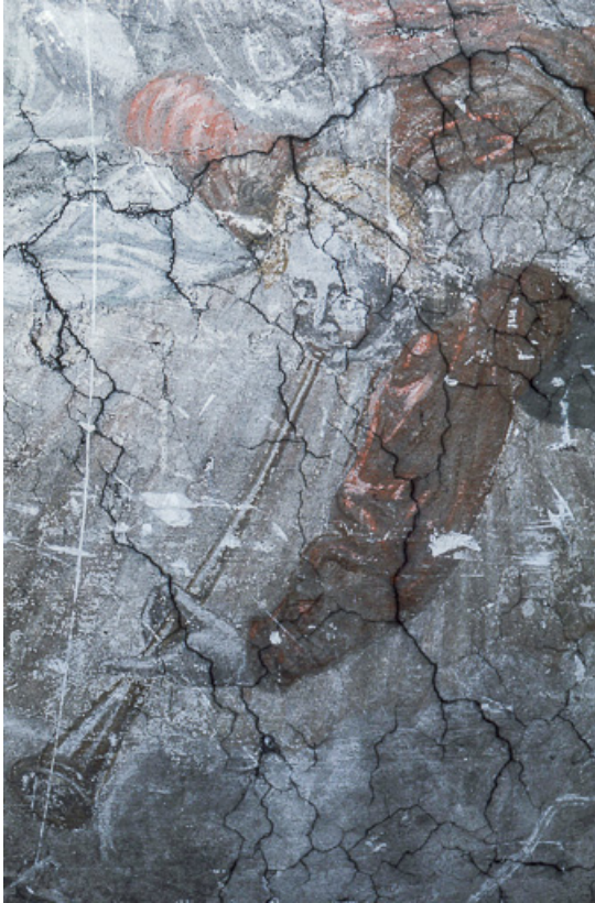
Le Jugement dernier : angelot jouant de la trompette.