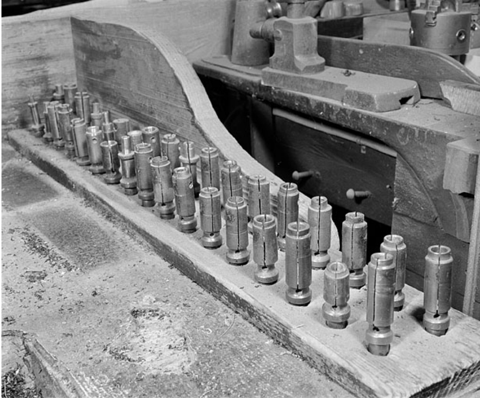
Jeu d'embouts de tailles différentes posés sur l'établi.

25, Baume-les-Dames rue des Pipes, lieudit : Gondé