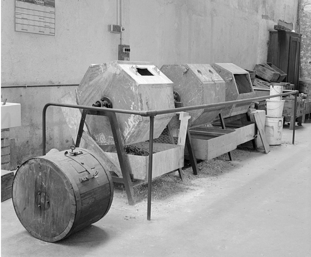
Vue d'ensemble avec, posé à gauche, un ancien modèle de tonneau.

25, Baume-les-Dames rue des Pipes, lieudit : Gondé