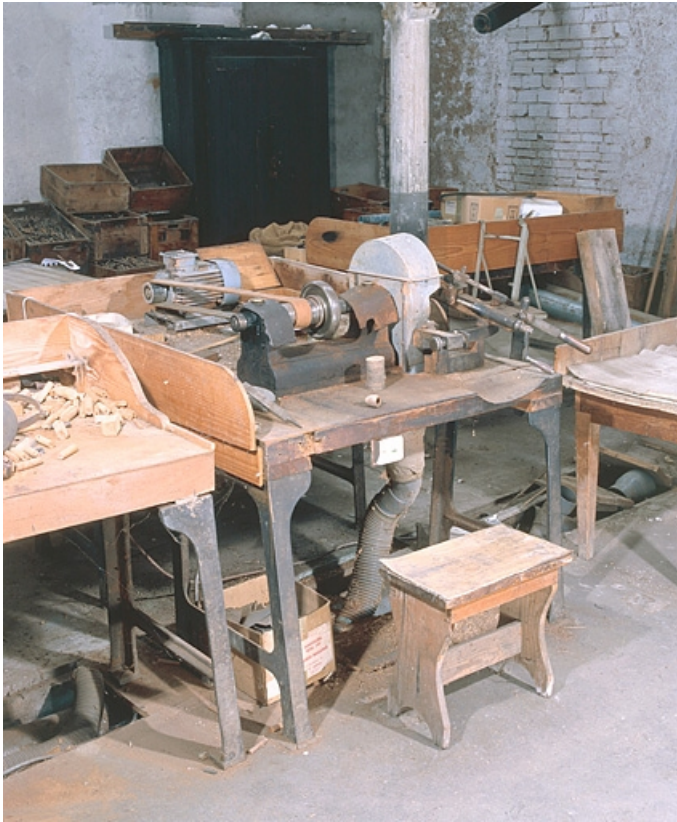
Vue d'ensemble de trois quarts gauche.

25, Baume-les-Dames rue des Pipes, lieudit : Gondé