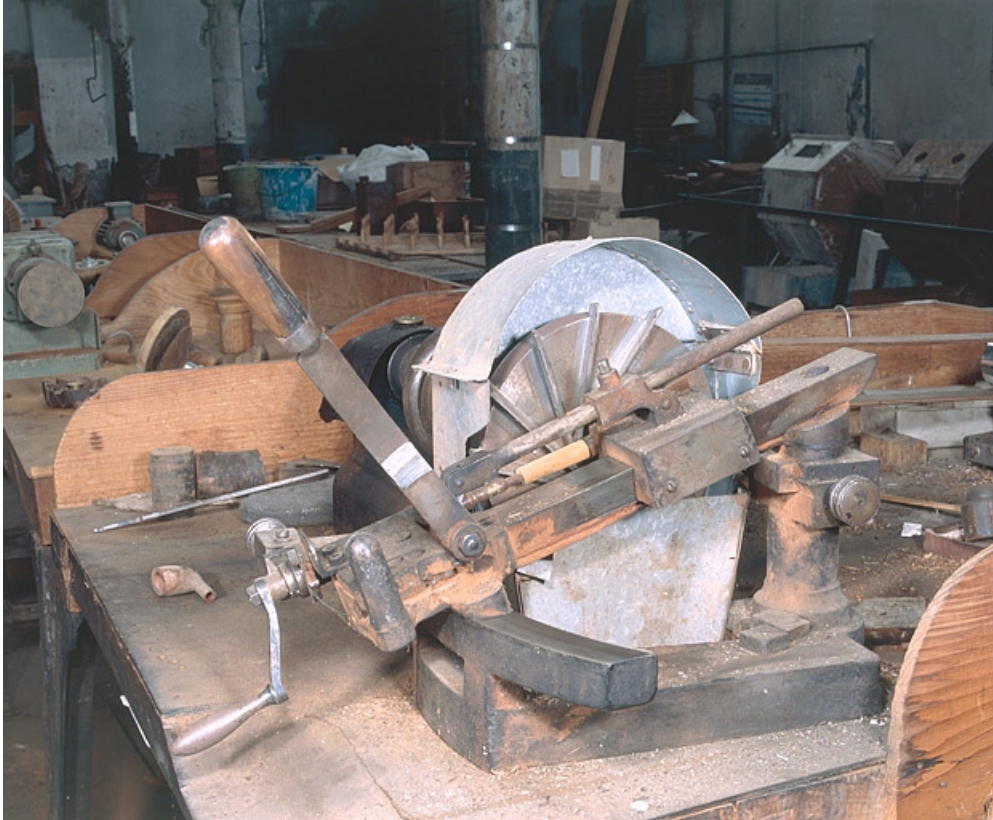
Vue d'ensemble rapprochée.

25, Baume-les-Dames rue des Pipes, lieudit : Gondé