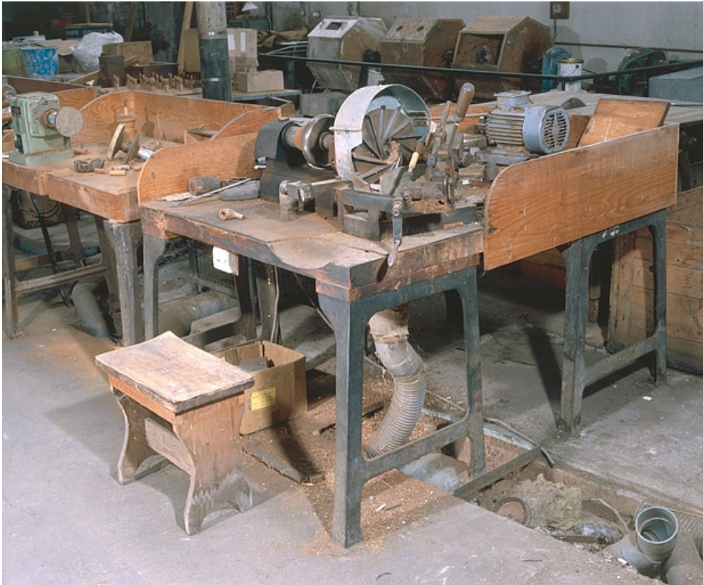
Vue d'ensemble de trois quarts droite.

25, Baume-les-Dames rue des Pipes, lieudit : Gondé