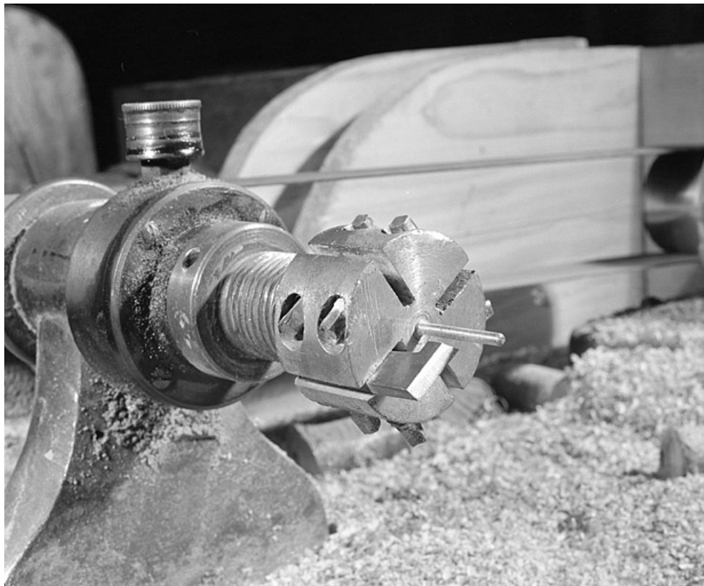
Détail de l'outil de coupe.

25, Baume-les-Dames rue des Pipes, lieudit : Gondé