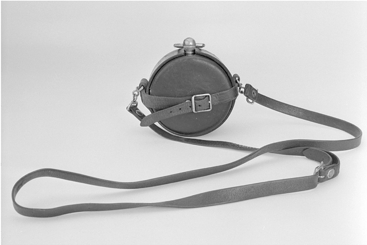
Vue d'ensemble avec l'étui en cuir.

25, Baume-les-Dames rue des Pipes, lieudit : Gondé