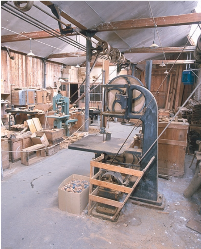
Vue de côté, avec la transmission par courroie.

25, Baume-les-Dames rue des Pipes, lieudit : Gondé