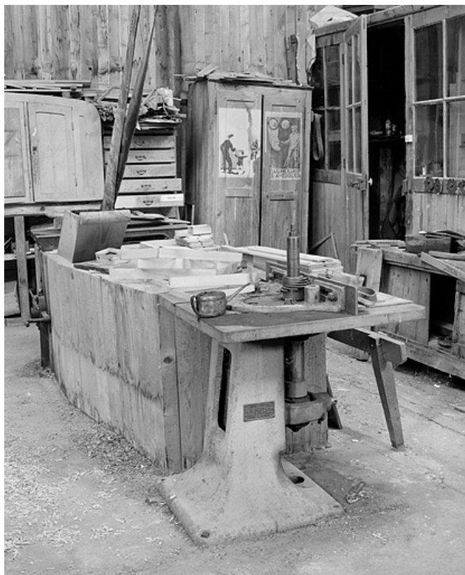
Vue d'ensemble. La caisse en bois dissimule le renvoi de la courroie de transmission.

25, Baume-les-Dames rue des Pipes, lieudit : Gondé