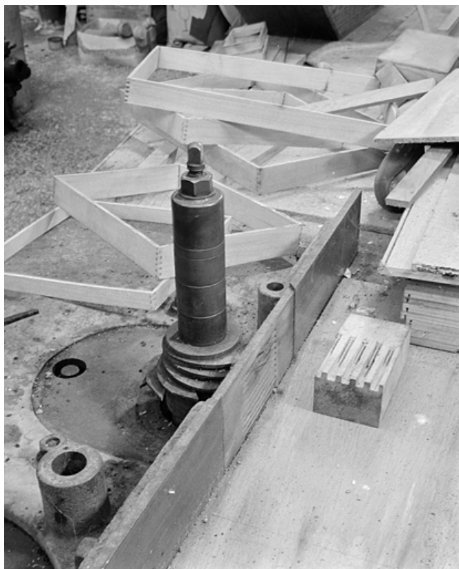
Détail de l'outil de coupe.

25, Baume-les-Dames rue des Pipes, lieudit : Gondé