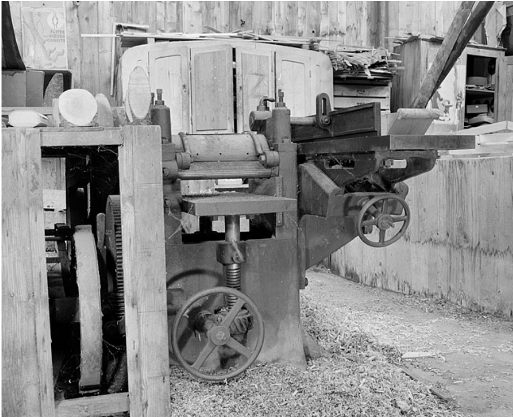
Détail de la face antérieure.

25, Baume-les-Dames rue des Pipes, lieudit : Gondé