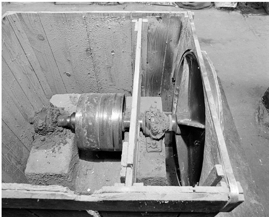
Vue plongeante sur le mécanisme d'entraînement (carcasse enlevée).

25, Baume-les-Dames rue des Pipes, lieudit : Gondé