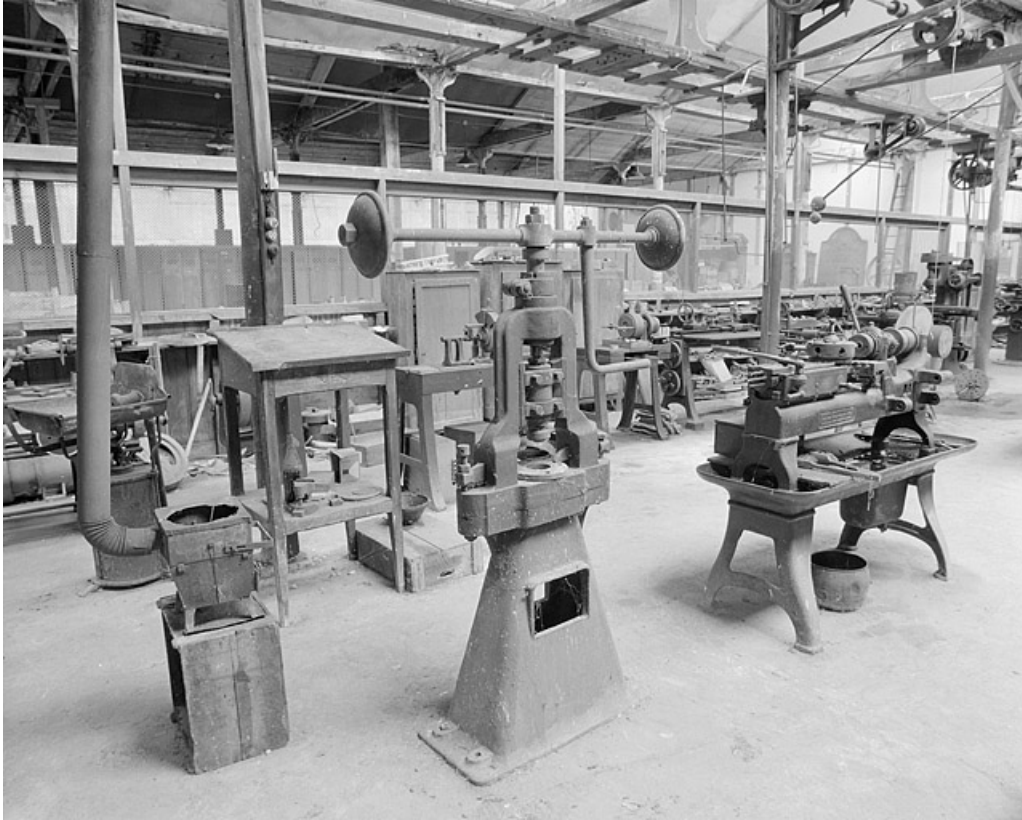
Vue depuis le nord-est.

25, Baume-les-Dames rue des Pipes, lieudit : Gondé