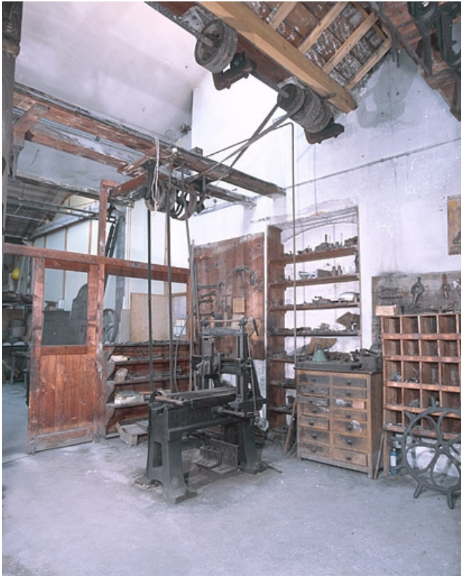
Vue de l'entrée.

25, Baume-les-Dames rue des Pipes, lieudit : Gondé