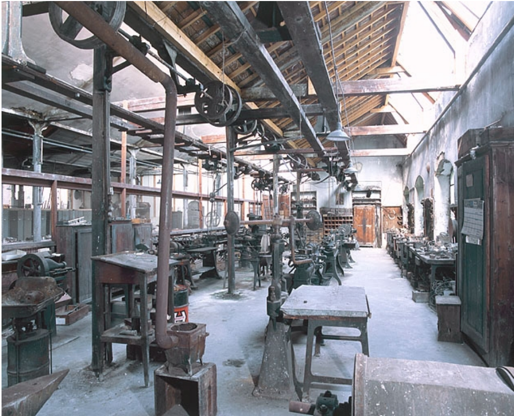
Vue d'ensemble depuis la forge.

25, Baume-les-Dames rue des Pipes, lieudit : Gondé