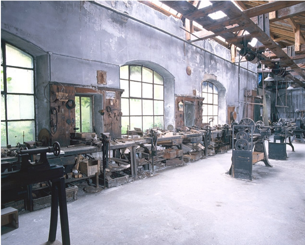
Rangée d'établis le long du mur nord.

25, Baume-les-Dames rue des Pipes, lieudit : Gondé