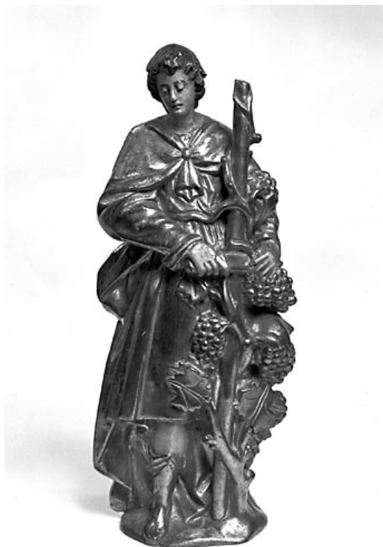
Saint Vernier : vue de face. 25, Vuillafans