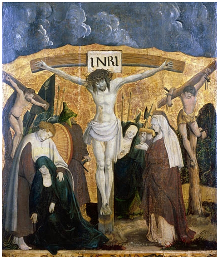
Crucifixion. 25, Vuillafans