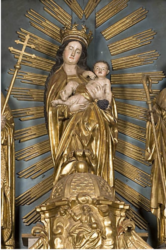
Vierge à l'Enfant, vue de face.