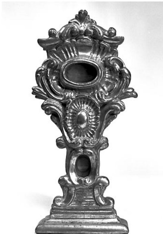
Vue d'ensemble d'un reliquaire.