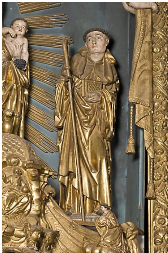
Saint Benoît, vue de face. 25, Vuillafans