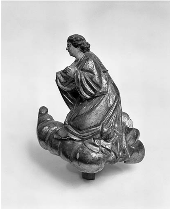
Ange de l'Annonciation.