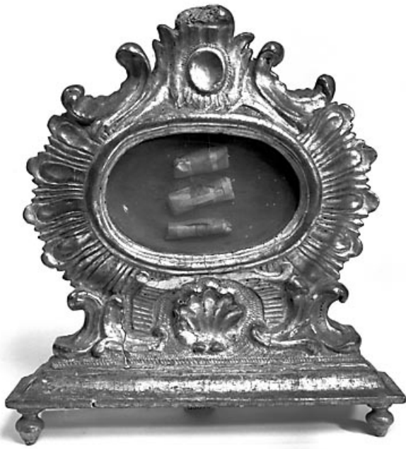
Vue d'ensemble d'un reliquaire.