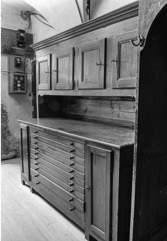
Vue d'ensemble du meuble de sacristie. 25, Saules