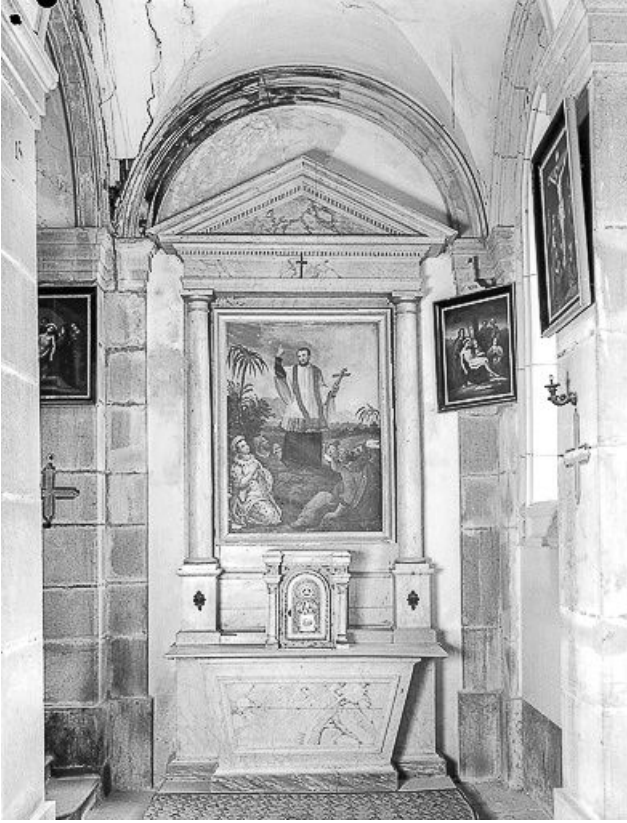
Autel secondaire sud.