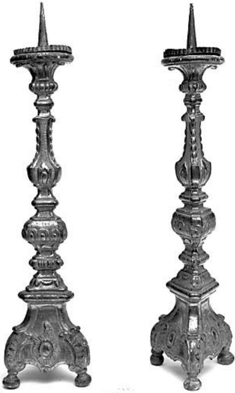
Vue d'ensemble de deux chandeliers d'autel. 25, Lods