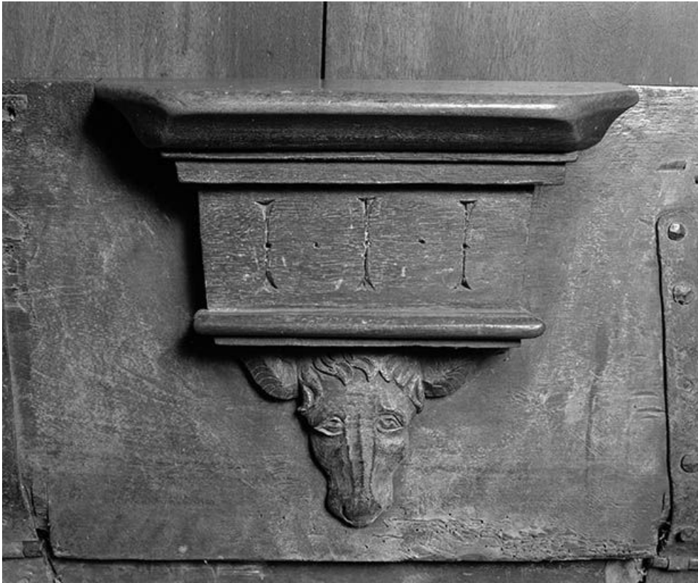
Détail : miséricorde côté nord n° 2.