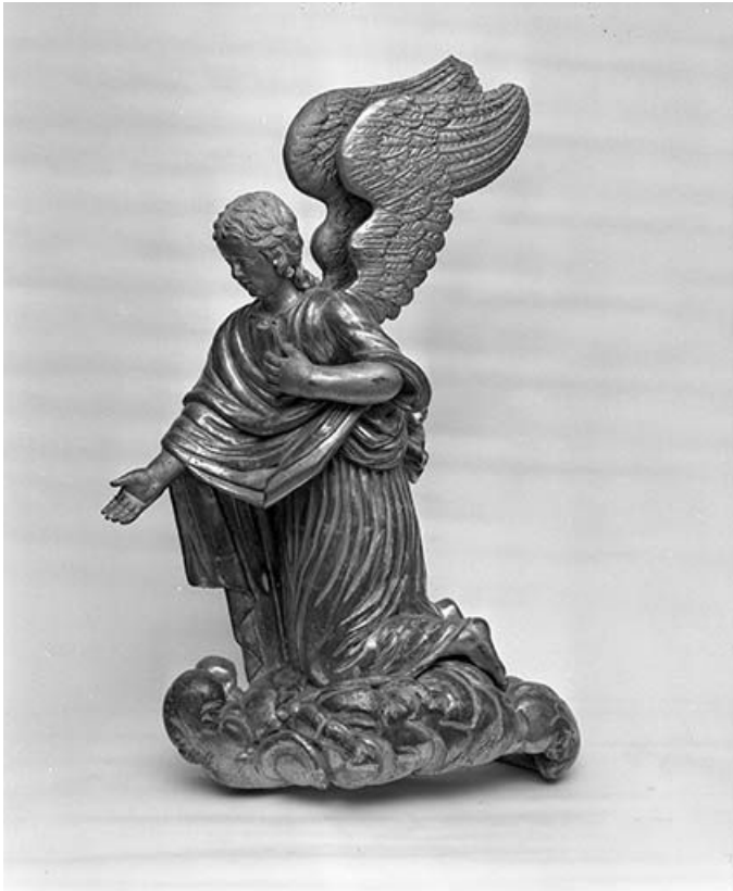
Ange de droite.