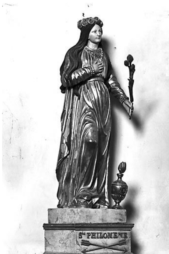
Vue de trois quart droit.