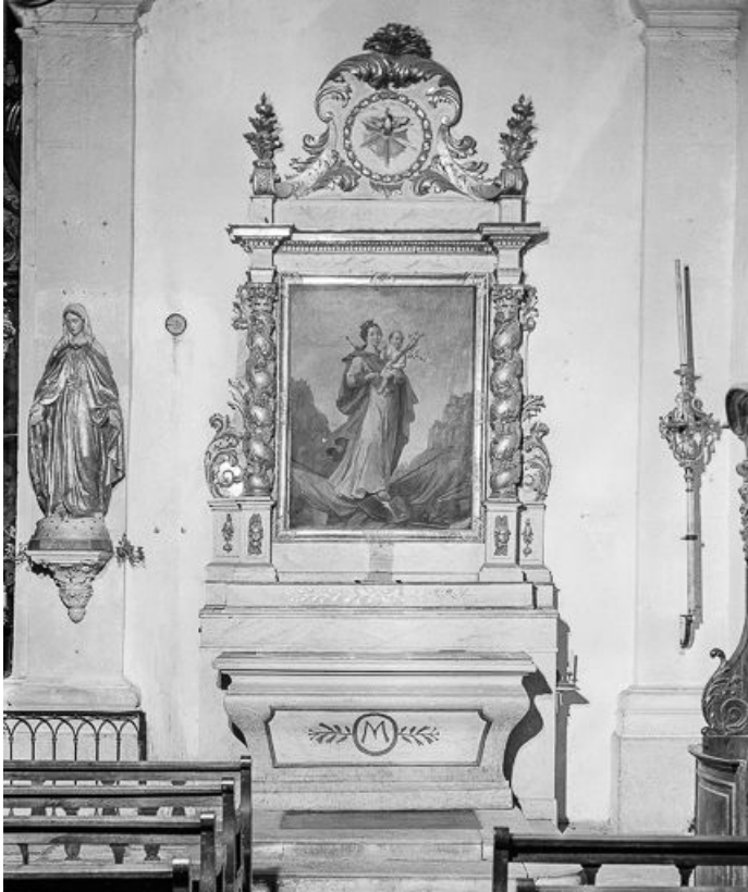
Vue d'ensemble de l'autel secondaire de la Vierge. 25, Lods