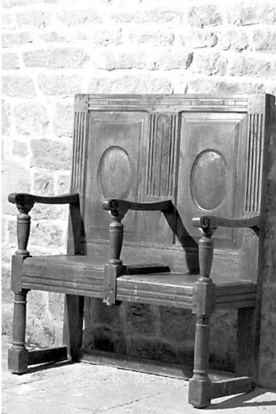
Vue d'ensemble. 25, Échevannes