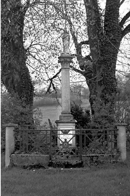
Vue d'ensemble de face.

25, Scey-Maisières, lieudit : près de Champey