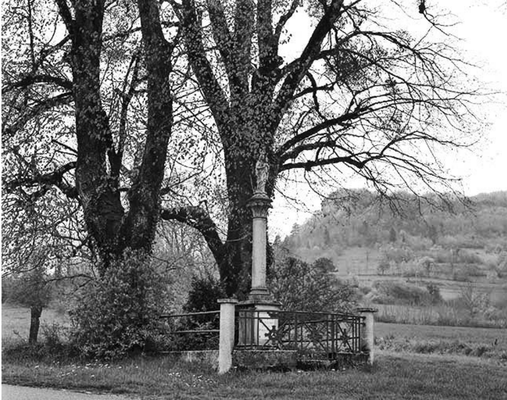
Vue d'ensemble de trois quart droit.

25, Scey-Maisières, lieudit : près de Champey