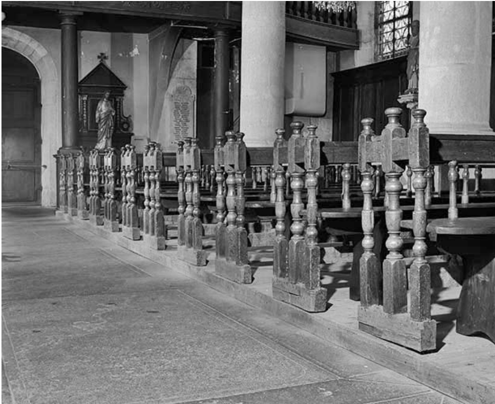
Détail : les montants du côté de la nef. 25, Chantrains