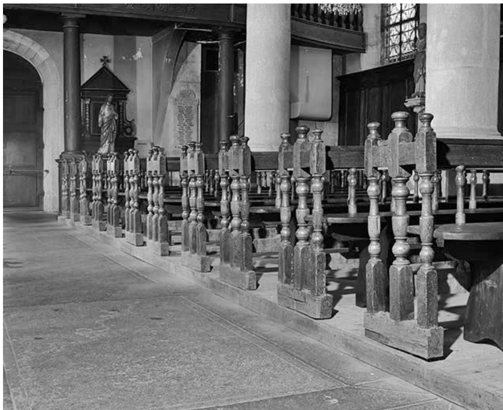
Détail : les montants du côté de la nef. 25, Chantrains