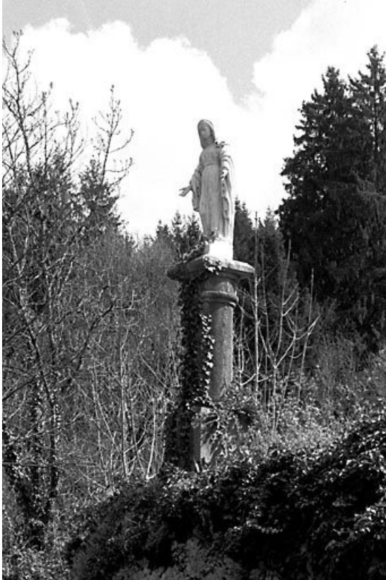
Vue de trois quart gauche.

25, Mouthier-Haute-Pierre, lieudit : près de Mouthier-Bas