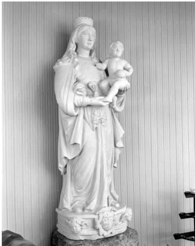
Vierge à l'Enfant.