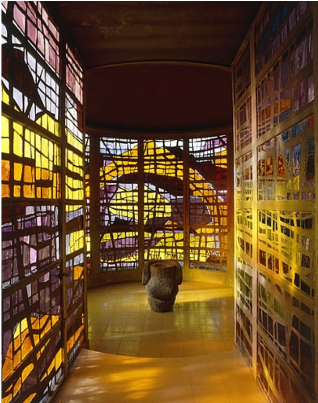
Vue d'ensemble du baptistère.