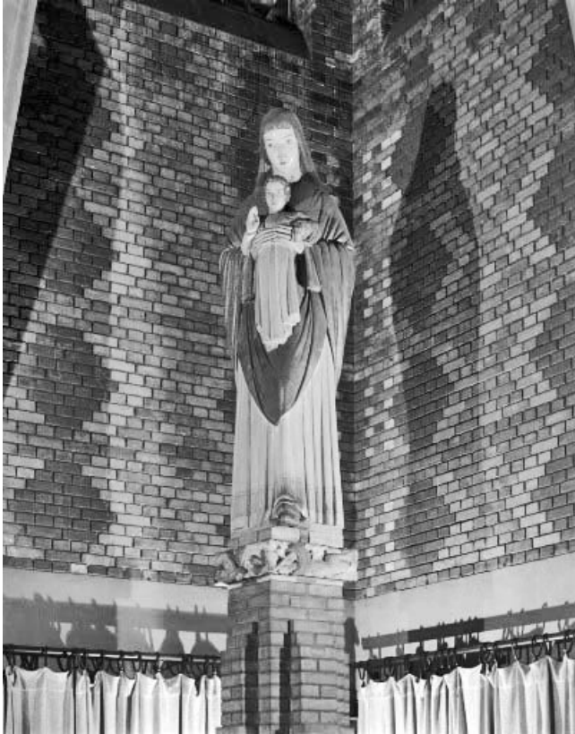
Statue : Vierge à l'Enfant.