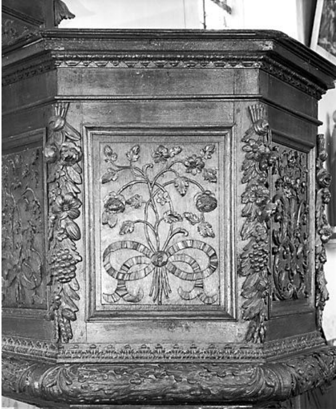
Le deuxième panneau de la cuve.