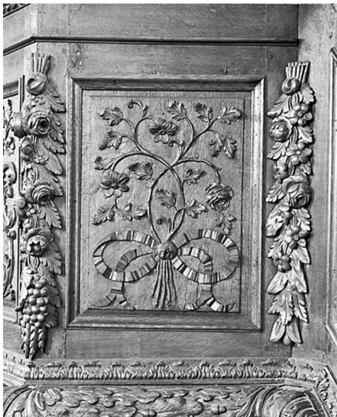
Le quatrième panneau de la cuve.