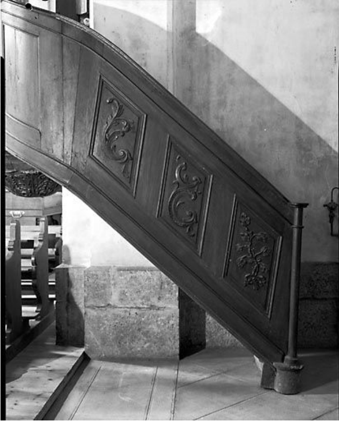
Détail de la rampe.