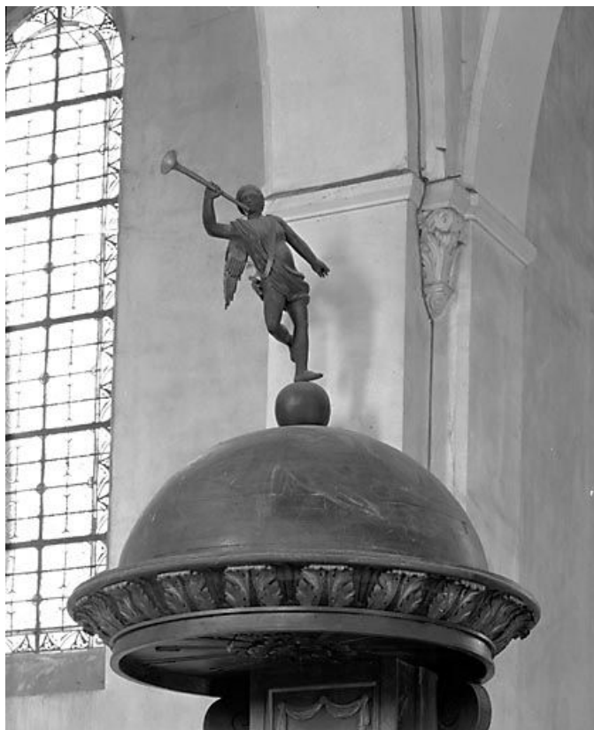
Détail du motif de couronnement : ange sonnant de la trompette. 25, Les Alliés