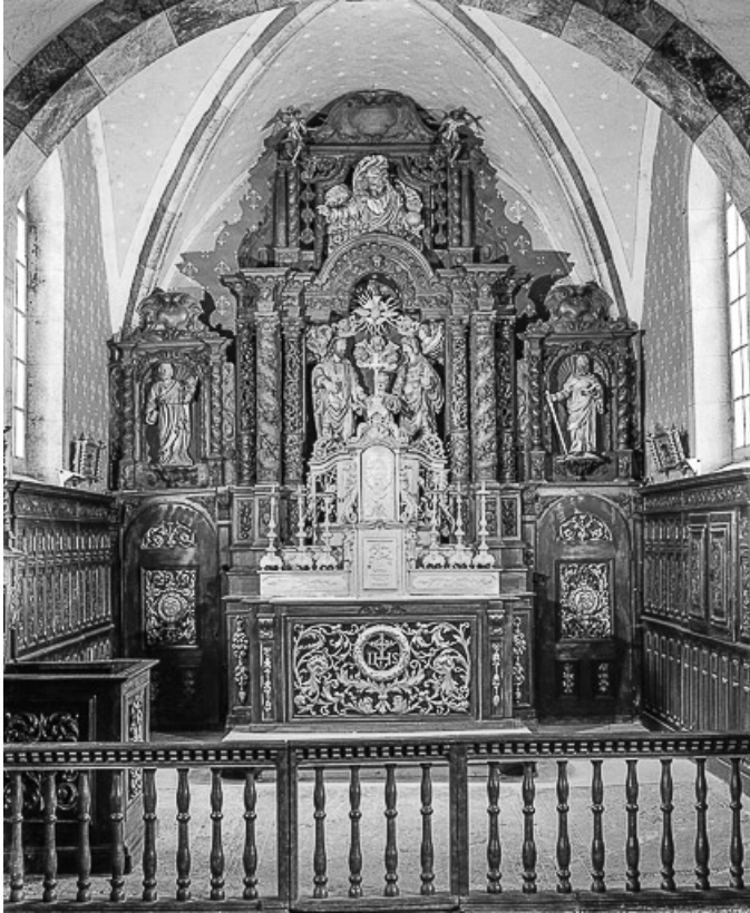
Maître-autel, vue d'ensemble.

25, Villers-le-Lac, lieudit : les Bassots