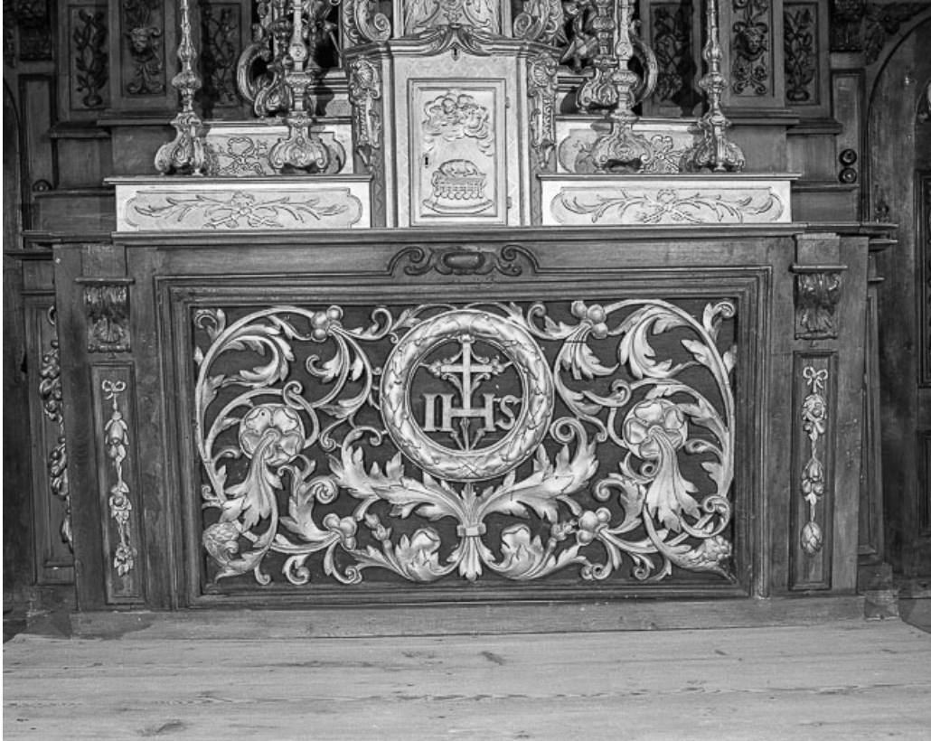
Détail du devant d'autel.

25, Villers-le-Lac, lieudit : les Bassots