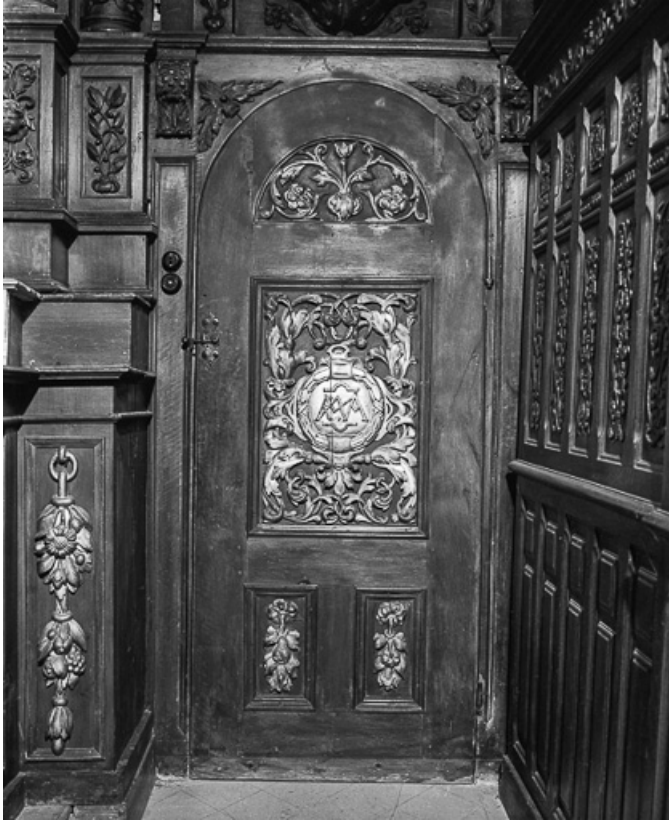
Détail du retable.

25, Villers-le-Lac, lieudit : les Bassots