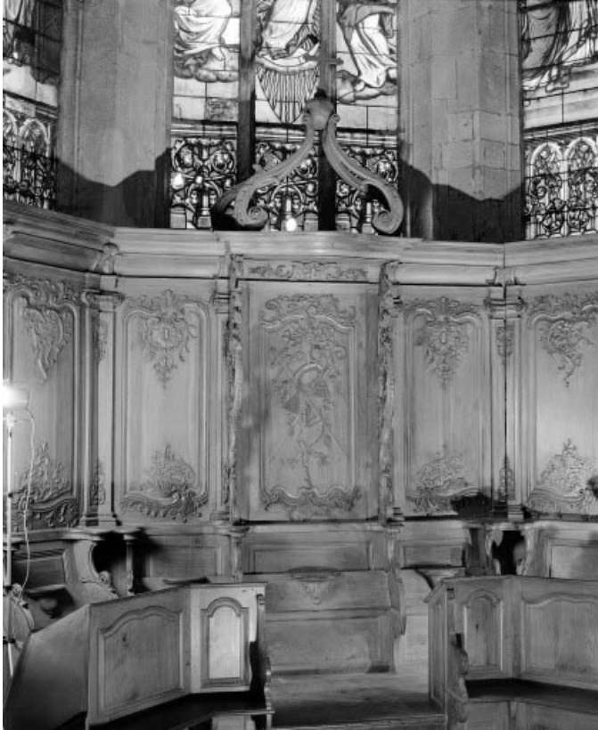
Détail : stalle de prieur.