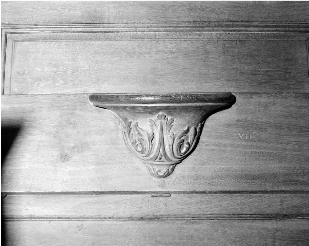
Détail : miséricorde avec motifs végétaux.