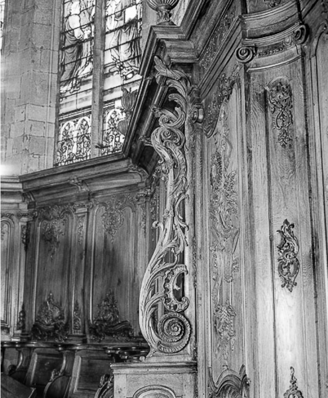
Jouée, côté droit.