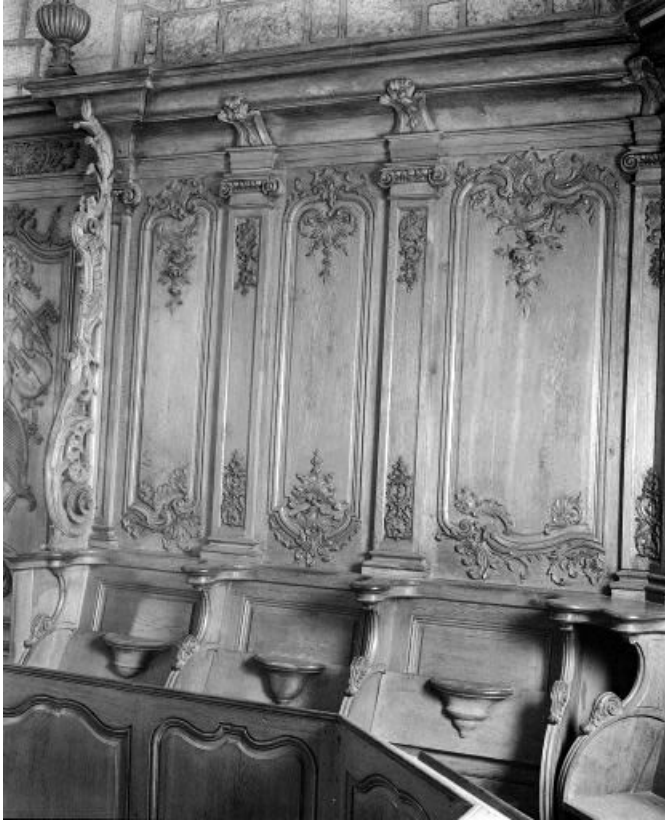
Détail : stalles et dorsaux I, II et III. 25, Morteau