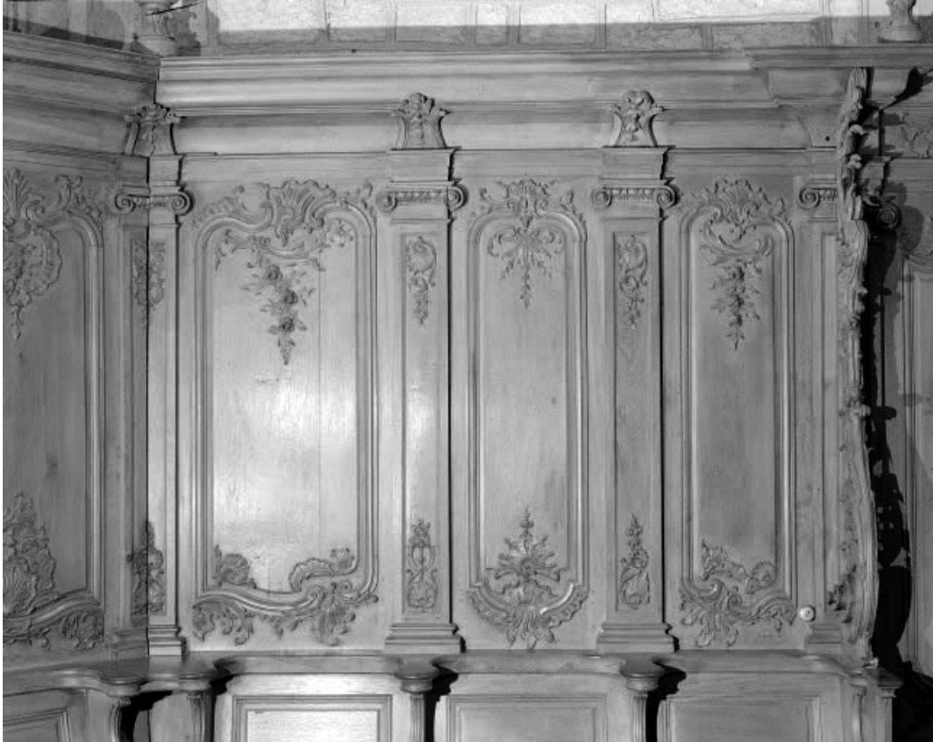
Détail : dorsaux des stalles du mur droit du chœur. 25, Morteau