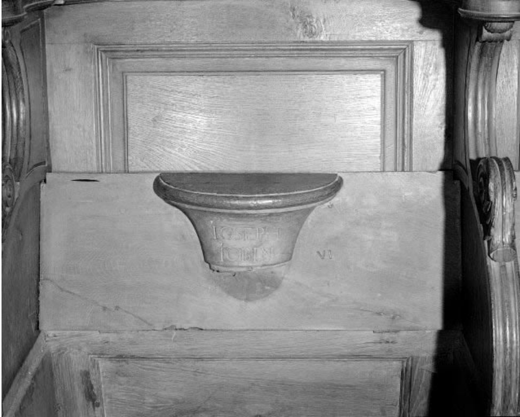
Détail : miséricorde avec signature JOSEPH IOBIN.