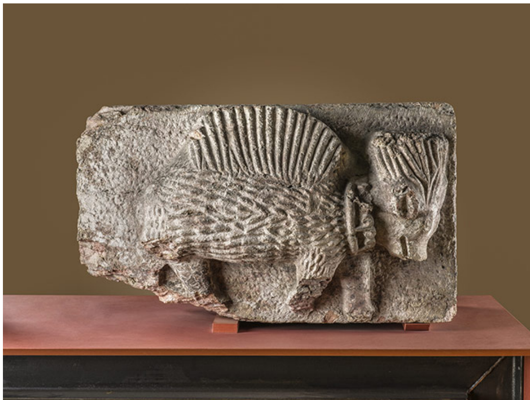
Second porc-épic (Arb.1892.1-4) : vue de profil. 21, Dijon