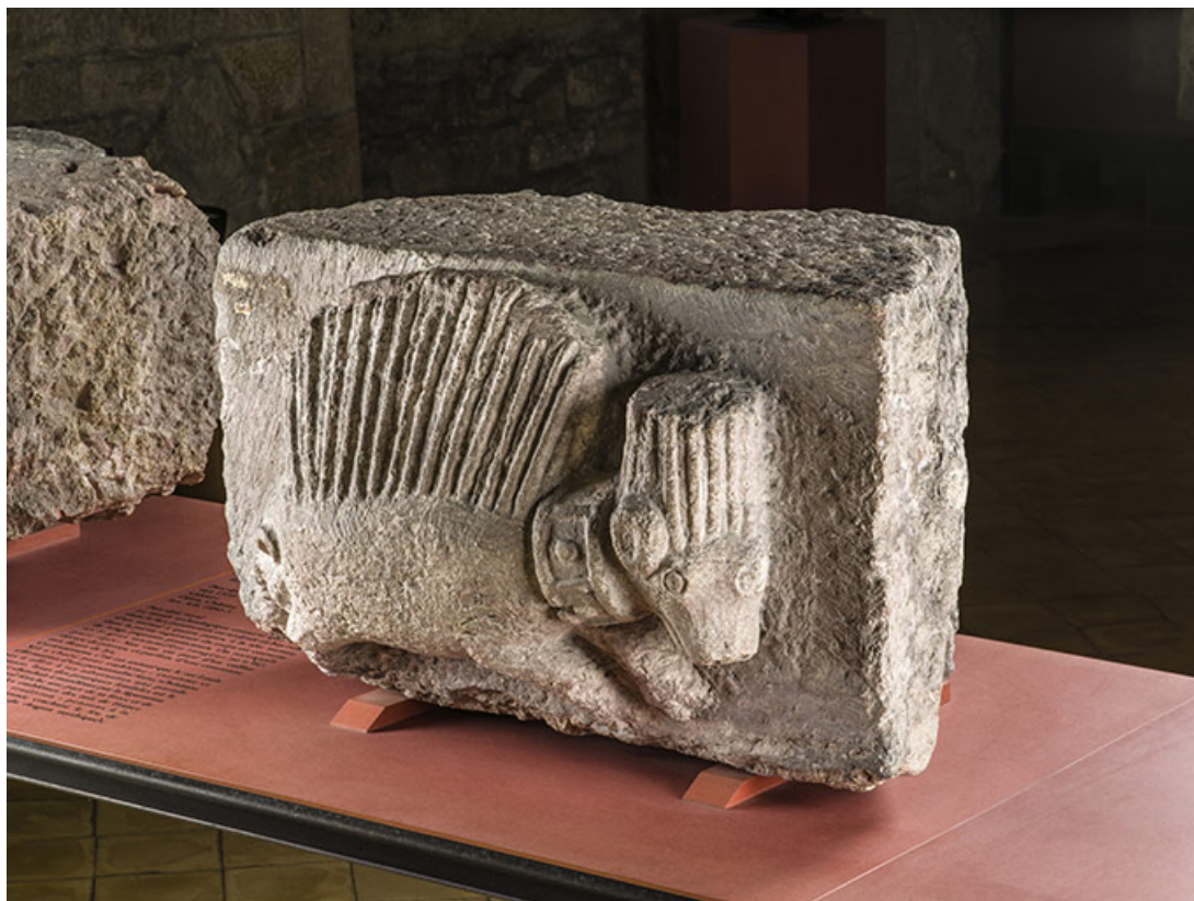
1er porc-épic (Arb.1892.1-1) : vue de trois quarts. 21, Dijon