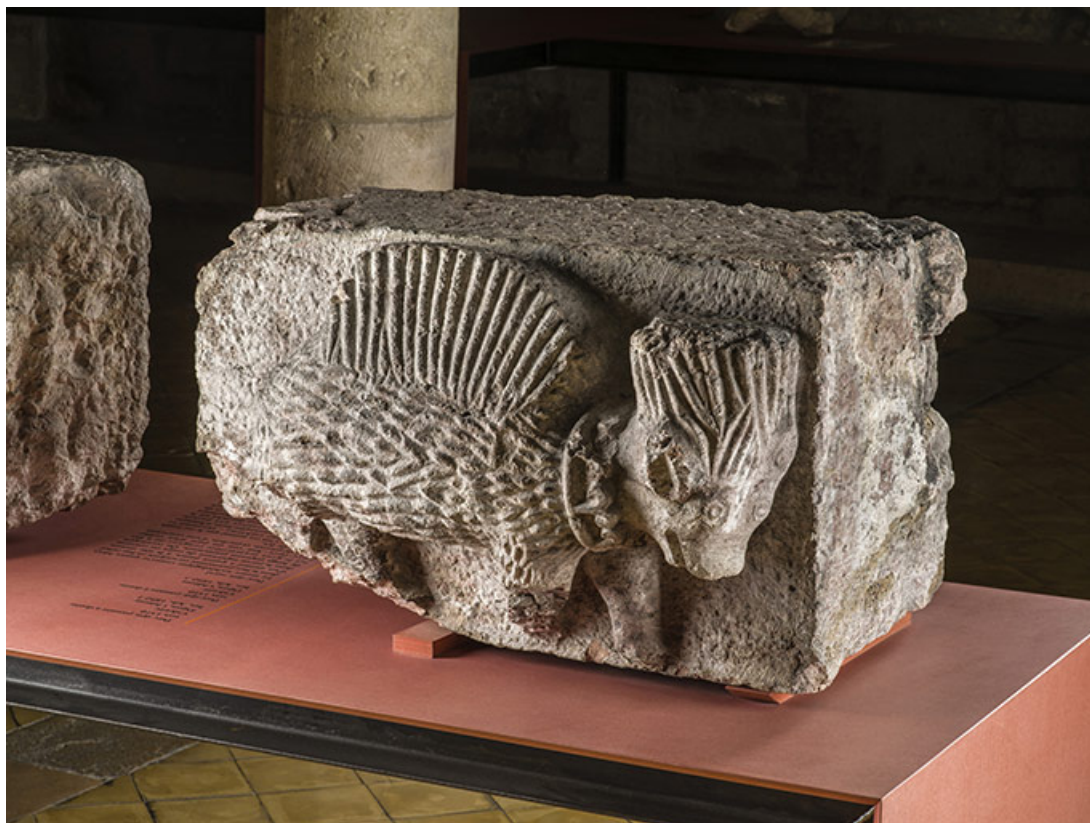
Second porc-épic (Arb.1892.1-4) : vue de trois quarts. 21, Dijon