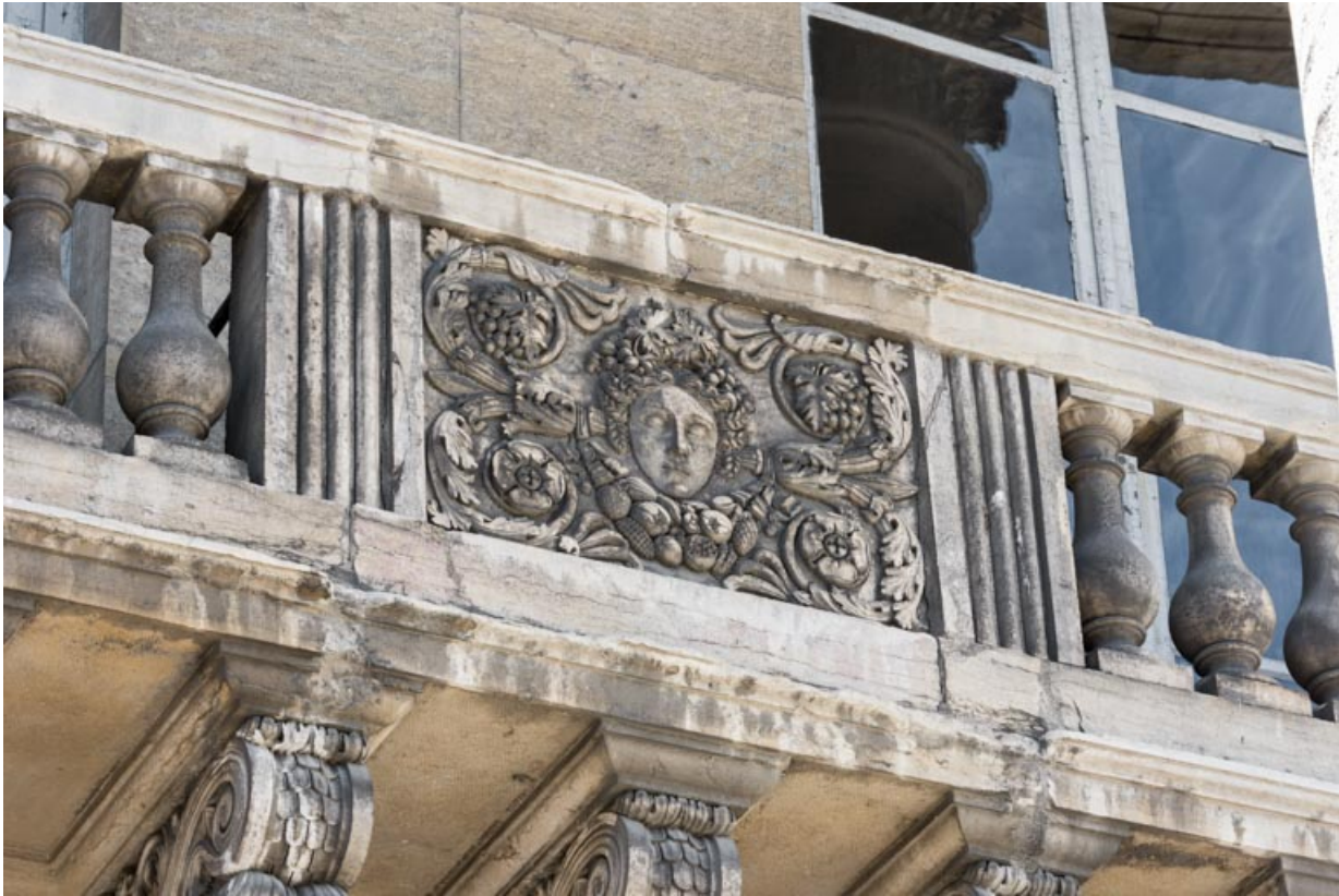
Bas-relief : l'Automne.