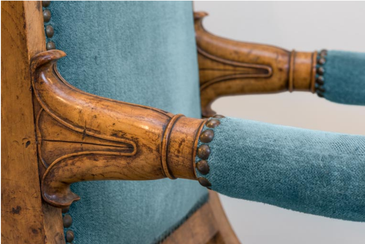
Fauteuil rembourré à dossier plat garni : décor des accotoirs.