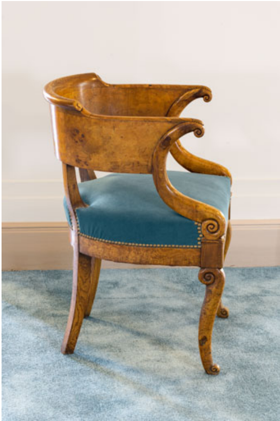
Fauteuil rembourré à dossier concave en bois, vu de profil.