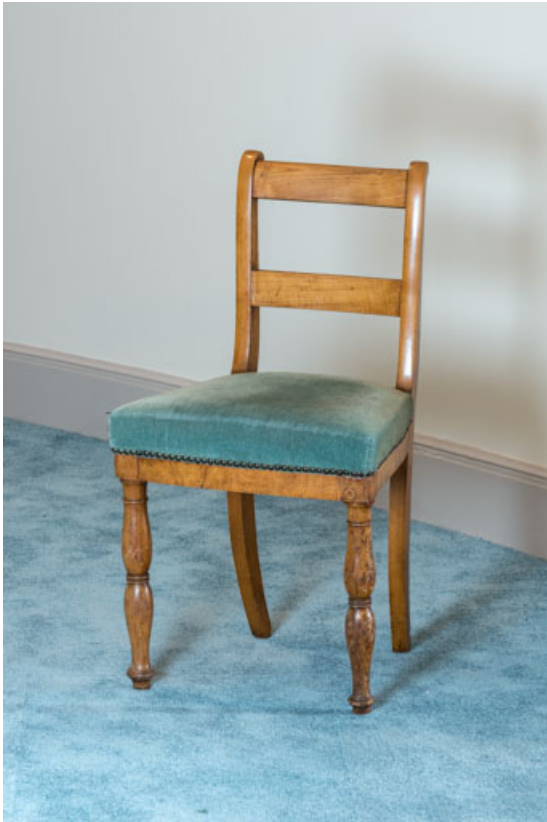
Chaise rembourrée à dossier plat à barreau.