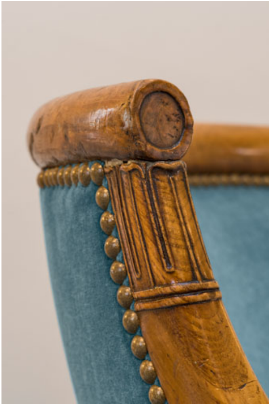
Fauteuil rembourré à dossier concave garni : décor de la traverse supérieure et d'un accotoir. 21, Dijon place du Théâtre