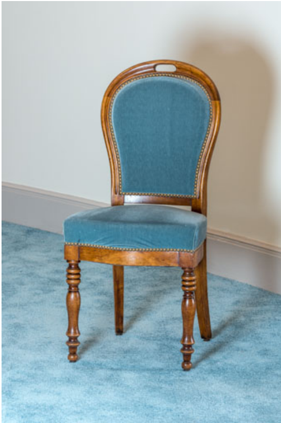
Chaise rembourrée à dossier plat garni ovale.