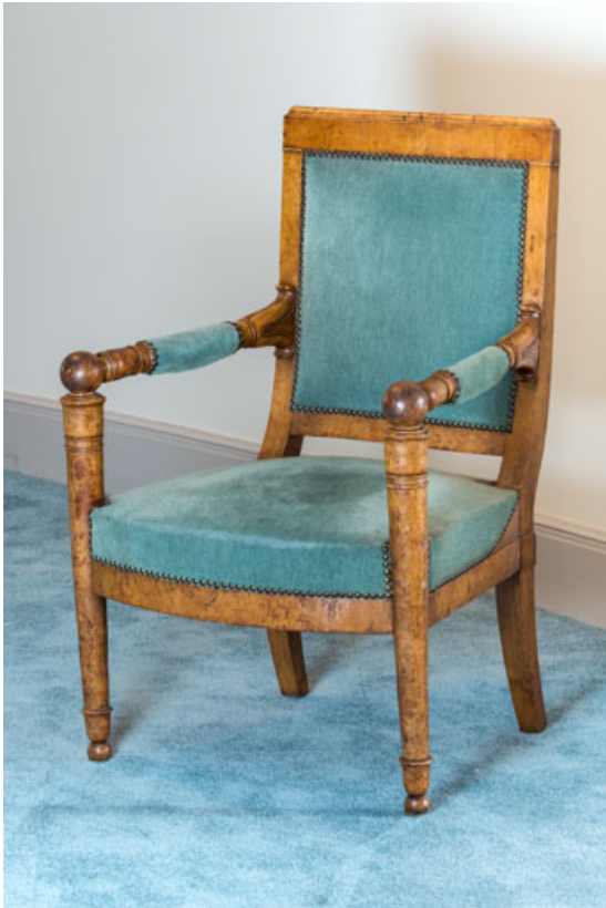
Fauteuil rembourré à dossier plat garni.