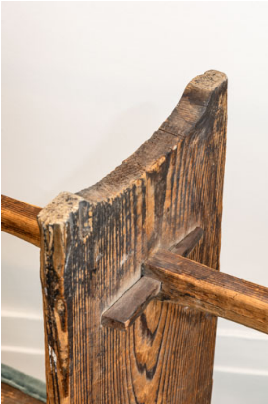
Banc rembourré rustique : détail de l'assemblage de la traverse inférieure. 21, Dijon place du Théâtre