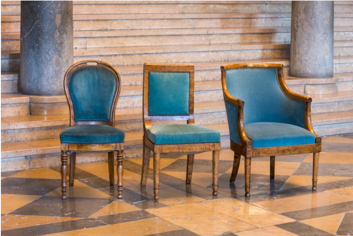
Trois sièges rembourrés à dossier garni : deux chaises (une à dossier concave ovale et une à dossier plat) et un fauteuil (à dossier concave).