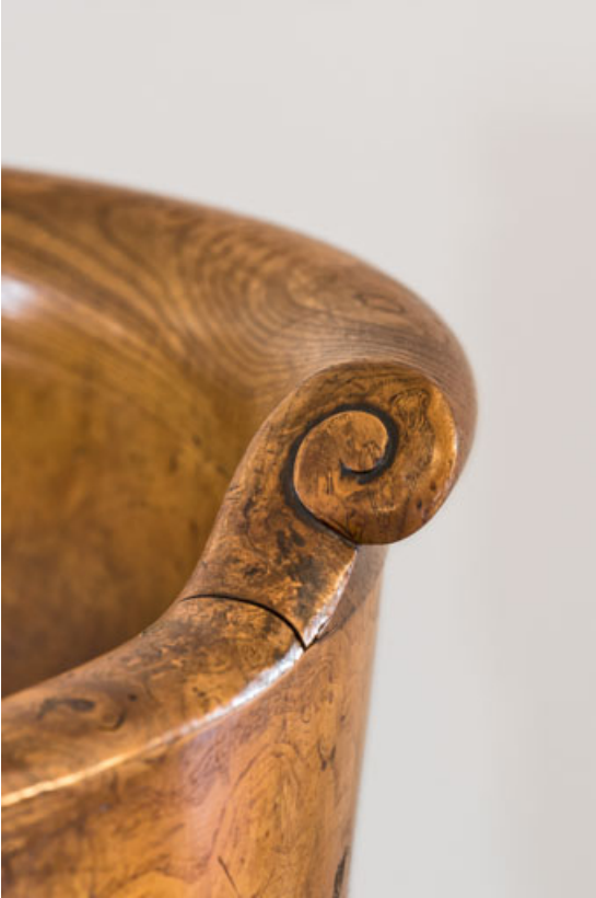
Fauteuil rembourré à dossier concave en bois : décor de la traverse supérieure. 21, Dijon place du Théâtre