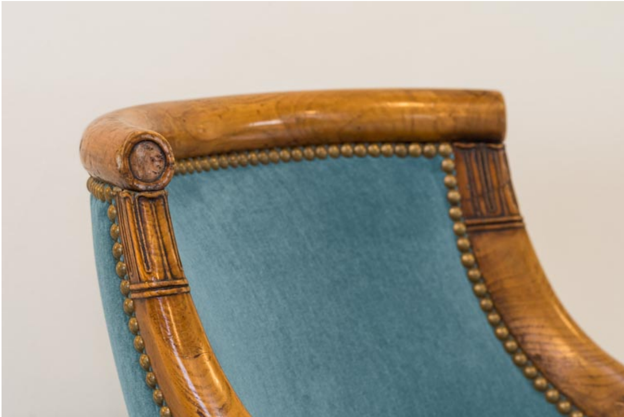
Fauteuil rembourré à dossier concave garni : décor de la traverse supérieure et des accotoirs. 21, Dijon place du Théâtre