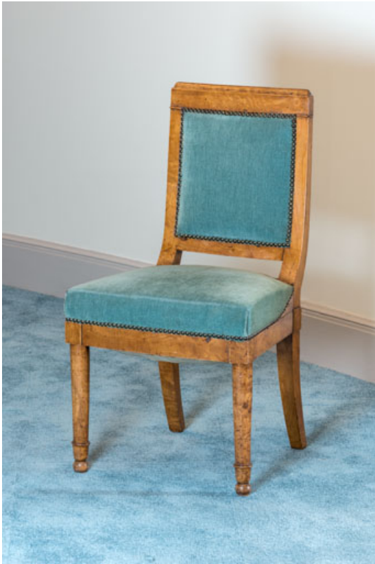
Chaise rembourrée à dossier plat garni.