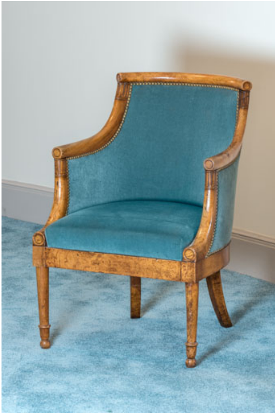
Fauteuil rembourré à dossier concave garni.