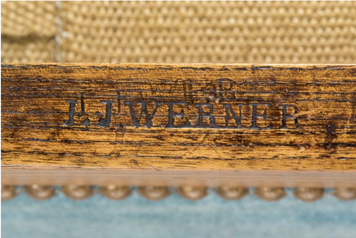
Tabouret rembourré : marque du fabricant J.-J. Werner.