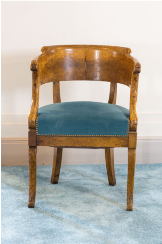
Fauteuil rembourré à dossier concave en bois (loge du préfet). 21, Dijon place du Théâtre