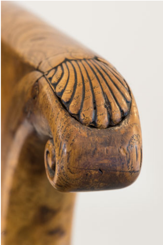
Fauteuil rembourré à dossier concave en bois : décor de l'accotoir. 21, Dijon place du Théâtre