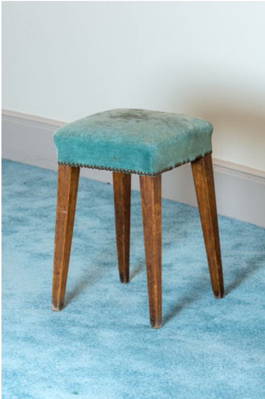
Tabouret rembourré rustique.