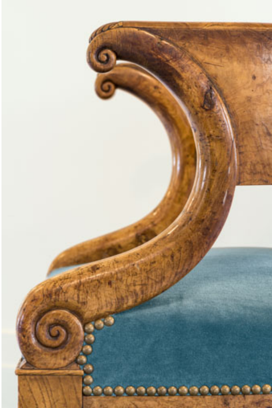
Fauteuil rembourré à dossier concave en bois : supports d'accotoir, vus de profil. 21, Dijon place du Théâtre