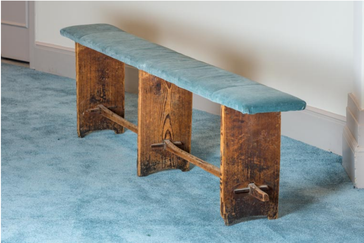
Banc rembourré rustique.